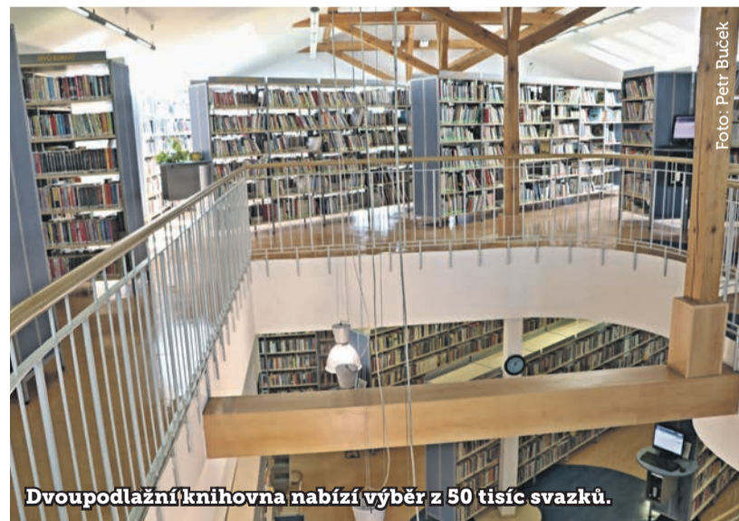
Dvoupodlažní knihovna nabízí výběr z 50 tisíc svazků.

R adotínská knihovna oslaví letos v září své 103. narozeniny. Knihovní kultura má v Radotíně své nezpochybnitelné místo, proto knihovna stále modernizuje, vylepšuje a rozšiřuje své služby. V současné době její knižní fond obsahuje přibližně 50 tisíc svazků, z toho 14 tisíc připadá na literaturu pro děti a mládež. Roční registrační poplatek činí 50 Kč pro děti a 150 Kč pro dospělé. Přijímáme platby hotově, kartou nebo bankovním převodem.