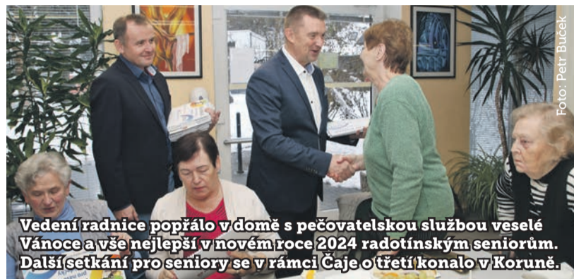
Vedení radnice poprálo v domě s pečovatelskou službou veselé Vánoce a vše nejlepší v novém roce 2024 radotínským seniorům. Další setkání pro seniory se v rámci Čaje o třetí konalo v Koruně.