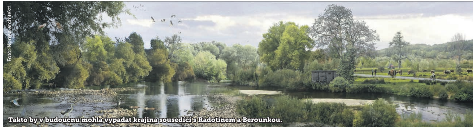
Takto by v budoucnu mohla vypadat krajina sousedící s Radotínem a Berouňkou.

M ezinárodní tým architektonických ateliérů Norma (Česko), EMF (Katalánsko/Španělsko) a Pareto (Francie) pracuje na podrobné studii Příměstského parku Soutok, která navazuje na soutěžní návrh uveřejněný loni v dubnu. Praha chce celému území mezi soutokem Berouňky s Vltavou, lemujičím Radotín a končícímu u Černošic, vrátit původnější, přírodní ráz.