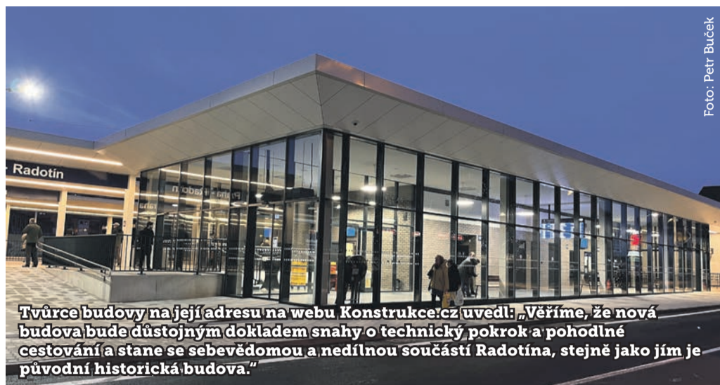
Tvůrce budovy na její adresu na webu Konstrukce.cz uvedl: „Věříme, že nová budova bude důstojným dokladem snahy o technický pokrok a pohodlné cestování a stane se sebevědomou a nedílnou součástí Radotína, stejně jako jím je původní historická budova.“