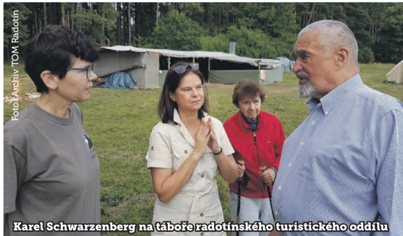
Karel Schwarzenberg na táboře radotínského turistického oddílu

L oni zesnulý politik Karel Schwarzenberg měl dlouholetý blízký vztah k radotínskému Turistickému oddílu mládeže TOM Radotín. Jak setkání probíhala, společně popisují ve svém textu vedoucí turistického oddílu.