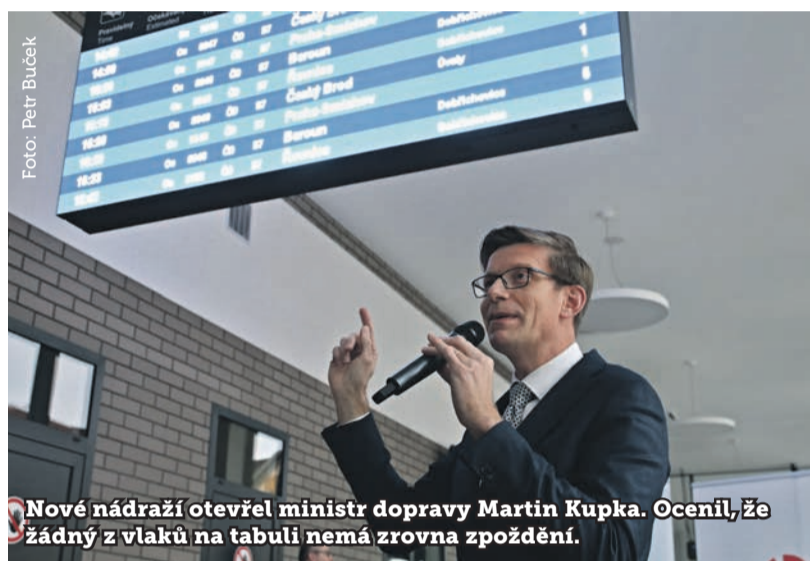
Nové nádraží otevřel ministr dopravy Martin Kupka. Ocenil, že žádný z vlaků na tabuli nemá zrovna zpoždění.

Zdroj: Správa železnic Poznámka: 1 Zaokrouhlené údaje