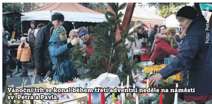
Vánoční trh se konal během třetí adventní neděle na náměstí sv. Petra a Pavla.