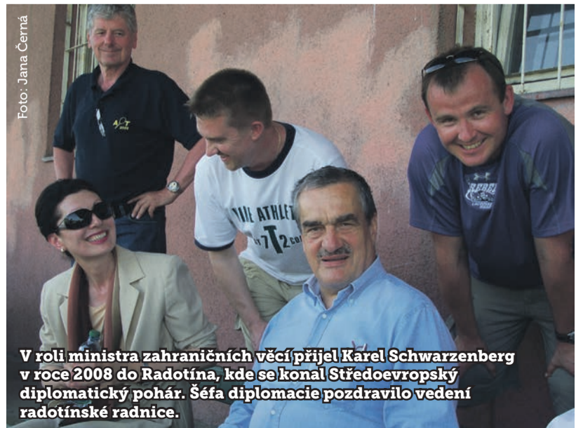
V roli ministra zahraničních věcí přijel Karel Schwarzenberg v roce 2008 do Radotína, kde se konal Středoevropský diplomatický pohár. Šéfa diplomacie pozdravilo vedení radotínských radnice.