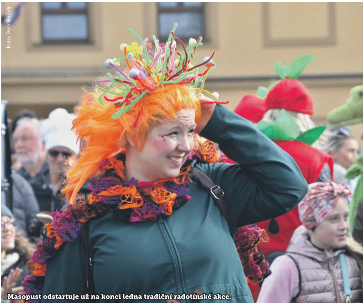
Masopust odstartuje už na konci ledna tradiční radotínské akce.

V novém roce pokračují tradiční akce pořádané Městskou částí Praha 16. Rozšíří se nabídka jarmarků na dvoře Koruny a po loňské premiéře se v červnu uskuteční druhý ročník celovíkendového Radotín Sportfestu.