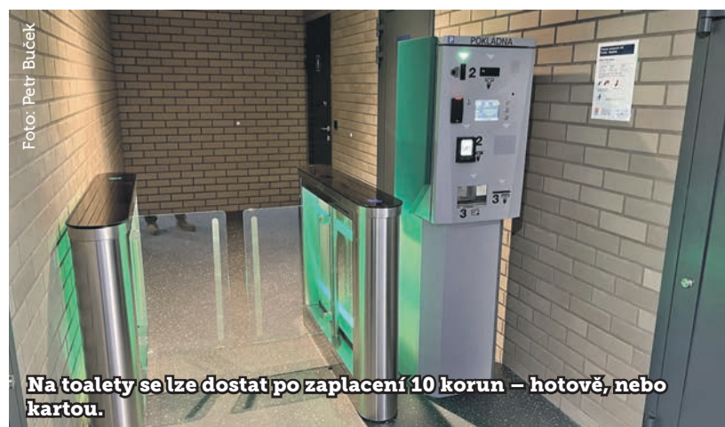
Na toalety se lze dostat po zaplacení 10 korun – hotově, nebo kartou.