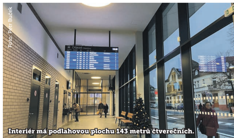
Interiér má podlahovou plochu 143 metrů čtverečních.