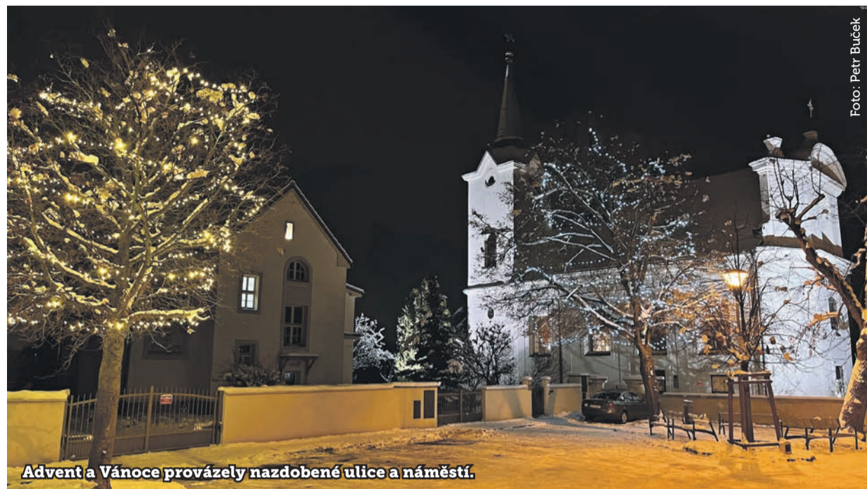
Advent a Vánoce provázely nazdobené ulice a náměstí.

P rosinec se nesl ve znamení adventu, oslav Vánoc a příchodu nového roku. Radnice a Kulturně-komunitní centrum Koruna pořádaly adventní koncerty, setkání pro seniory, pro děti se hrálo divadlo, konal se jarmark i vánoční trh. Mikulášské akce pořádali v knihovně, Koruně a také dobrovolní hasiči. ■