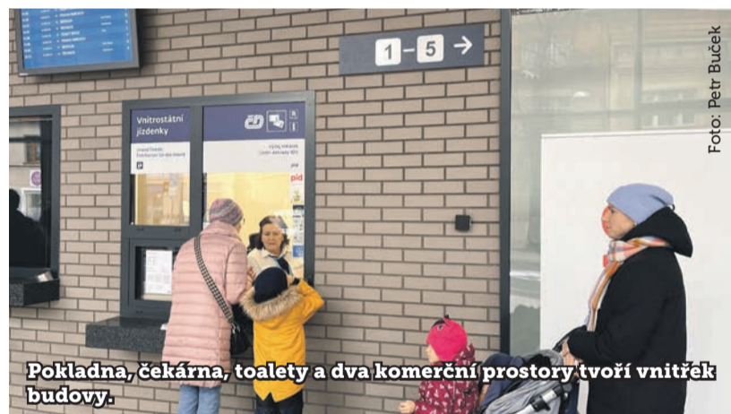
Pokladna, čekárna, toalety a dva komerční prostory tvoří vnitřek budovy.