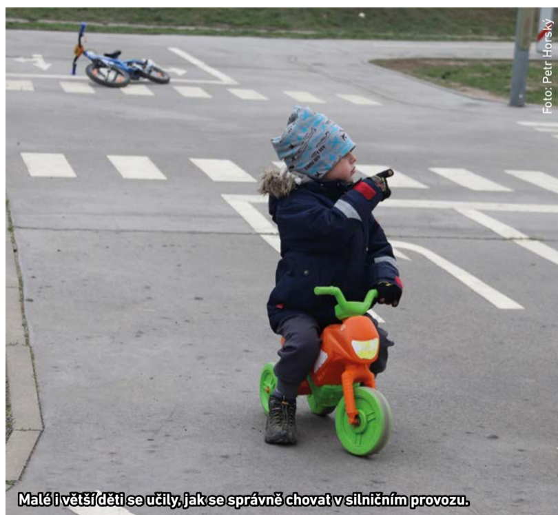
Malé i větší děti se učily, jak se správně chovat v silničním provozu.