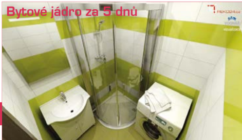
Bytové jádro za 5 dnů