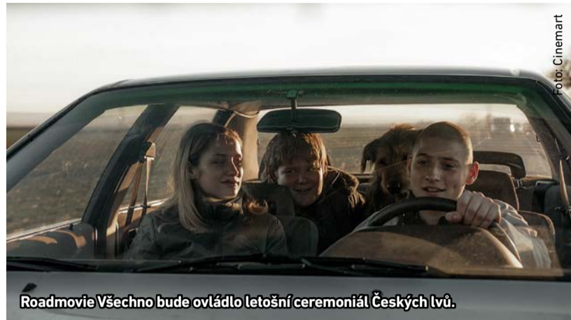
Roadmovie Všechno bude ovládlo letošní ceremoniál Českých lvů.

Kino Radotín uvede v květnu každé úterý od 17.30 hodin filmy, které získaly některou z cen na letošních Českých lvech. A poslední květnovou středu promítne dokumentární film o skejtácích.