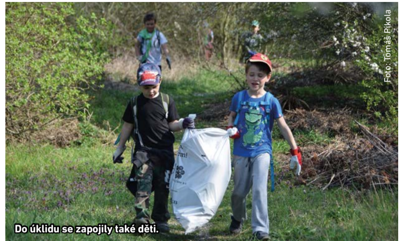
Do úklidu se zapojily také děti.