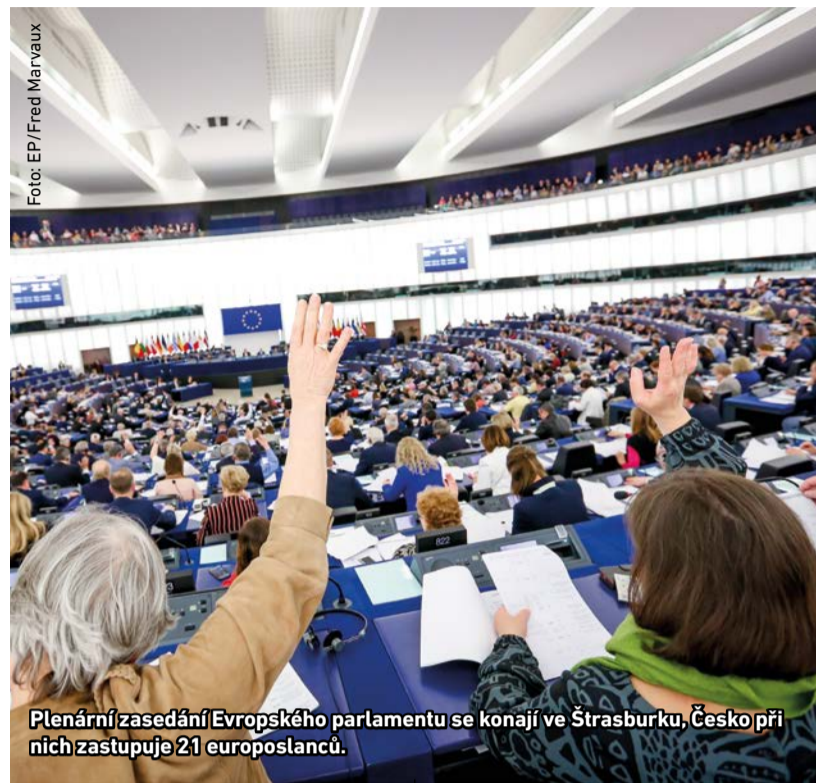
Plenární zasedání Evropského parlamentu se konají ve Štrasburku, Česko při nich zastupuje 21 europoslanců.

Své zástupce do Evropského parlamentu budeme volit v pátek 24. a v sobotu 25. května. Volební místnosti budou otevřené v pátek od 14 do 22 hodin a v sobotu od 8 do 14 hodin. Voličské průkazy se pro volby do Evropského parlamentu vydávají, avšak volba s nimi je možná jen na území České republiky.