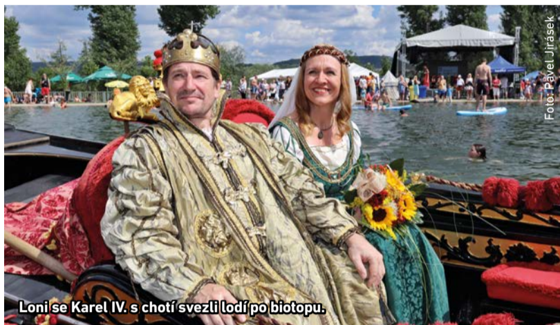
Loni se Karel IV. s chotí svezli lodí po biotopu.