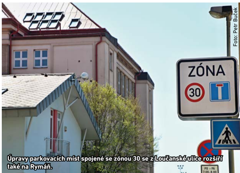
Úpravy parkovacích míst spojené se zónou 30 se z Loučanské ulice rozšíří také na Rymáně.

Radotínská radnice reaguje na připomínky občanů z domů v okolí Loučanské ulice a Rymáně několika změnami v dopravě. Oblast v sousedství škol čelí velkému množství aut ráno před začátkem vyučování a v letních měsících od nedisciplinovaných návštěvníků biotopu.