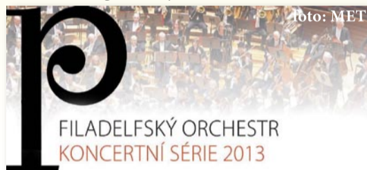
FILADELFSKÝ ORCHESTR KONCERTNÍ SÉRIE 2013

s množstvím tanečníků, videoprojekcí a s divadelním nasvícením. Philadelphia má krom toho za sebou také své první americké vystoupení Ravelova Klavírního koncertu v G dur, který přednese hvězdný sólista Jean-Yves Thibaudet. Program zahájí „Moderní Filadelfie“, světová premiéra zbrusu nové skladby Olivera Knussena, ve společném provedení s Filadelfským orchestrem a Pittsburghskou Symfonií. -kd-