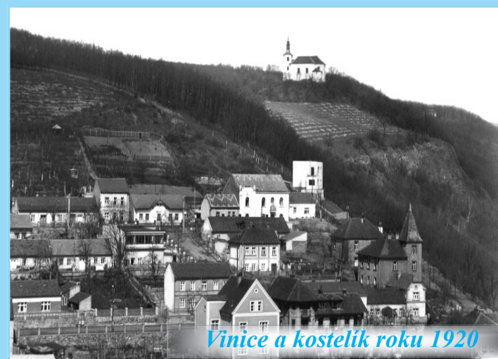
Vinice a kostelík roku 1920