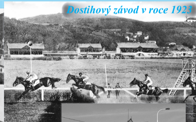
Dostihový závod v roce 1923