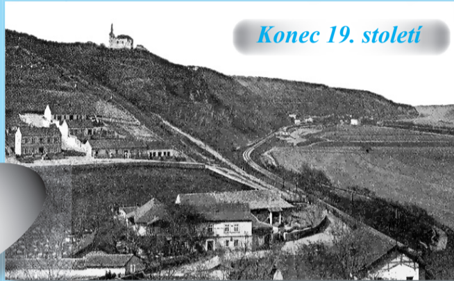
Konec 19. století