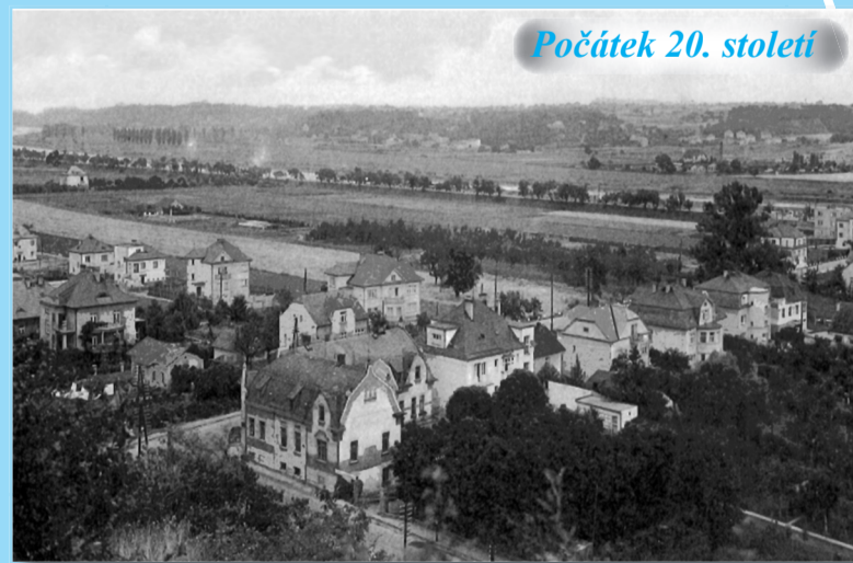
Počátek 20. století