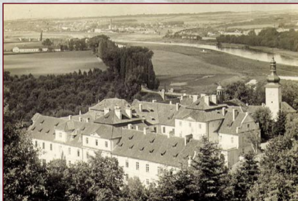
Pohled z KS k Lahovicím