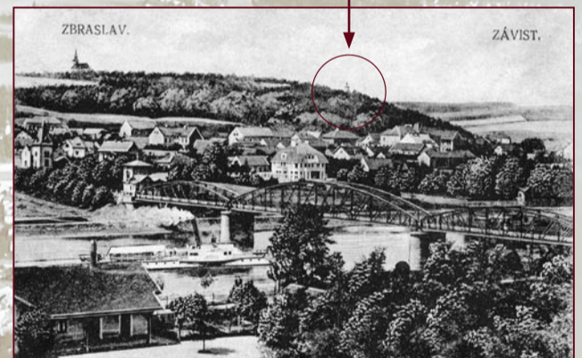
Havlín kolem roku 1900 a v současnosti