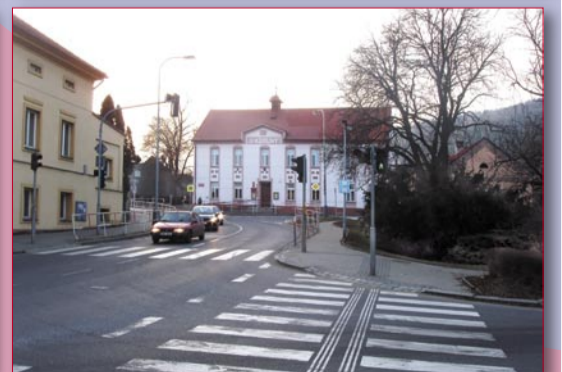
Materiály a text: Základní škola Praha - Radotín