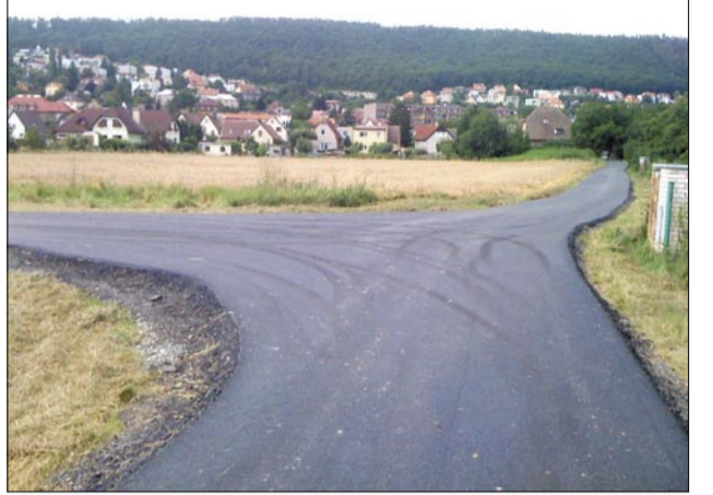
Nová asfaltka pro cyklisty a bruslaře