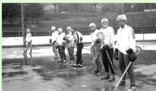
ZÁPAS V ČERNOŠICÍCH (KDE MUŽSTVO I TRÉNOVALO) V ROCE 1986

O TOMTO SPORTU TU JIŽ V NAŠEM SERIÁLU ŘEČ BYLA – V KVĚTNU JSME SE OHLÉDLI ZA UPLYNULÝMI ROČNÍKY MEMORIÁLU ALEŠE HŘEBESKÉHO. POSLEDNÍ DÍL VĚNUJEME LAKROSU JAKO TAKOVÉMU. PŮVODNÍ HRA INDIÁNSKÉHO KMENE IROKÉŽŮ ZAKOTVILA V RADOTÍNĚ NA POČÁTKU OSMDESÁTÝCH LET. LACROSSE CLUB CUSTODES RADOTÍN (LCC) BYL ZALOŽEN V ZÁŘÍ ROKU 1980, PŮVODNĚ SE ZÚČASTNIL LIGY V JEDNORUČNÍM, TZV. ČESKÉM LAKROSU. PO DESETI LETECH BEZ VLASTNÍHO ZÁZEMÍ SE STAL SOUČÁSTÍ SOKOLA RADOTÍN, KDE DNES MÁ VLASTNÍ ARÉNU A NĚKOLIK ODDÍLŮ – OD DĚTSKÝCH PO SENIORSKÉ. POVĚŠINOU VELMI ÚSPĚŠNÉ.