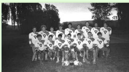
MUŽI LCC V RADOTÍNSKÝCH ŘÍČNÍCH LÁZNÍCH