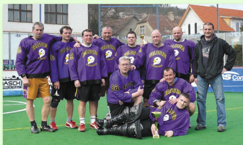
NA VETERÁNSKÉM TURNAJI V ROCE 2009 SE PŮVODNÍ SESTAVA SEŠLA PO 25 LETECH