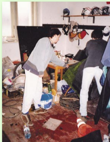
ŠATNY V SOKOLOVNĚ SLOUŽILY BĚHEM VÝSTAVBY HRŠTĚ SOUČASNĚ I JAKO SKLAD (ROK 2001)