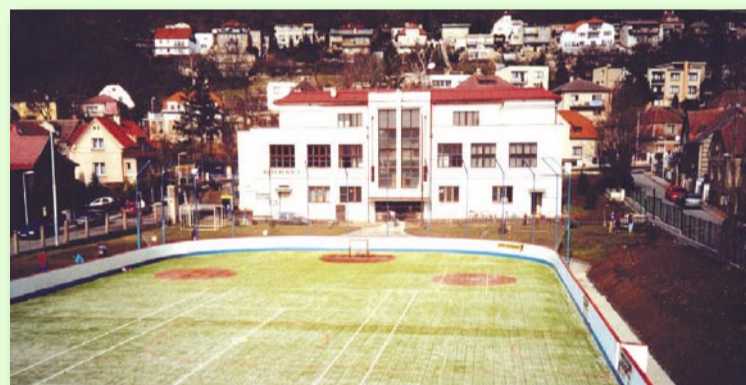
BŘEZEN 2001 – V TOMTO ROCE DOSTALA PLOCHA NOVÝ POUVRCH, NA FOTOGRAFII JE VIDĚT I NOVĚ NAVRSTVENÉ NÁSPY PRO BUDOUCÍ TRIBUNY. TY PRVNÍ BYLY PROVIZORNĚ SESTAVENY Z LEŠENÍ