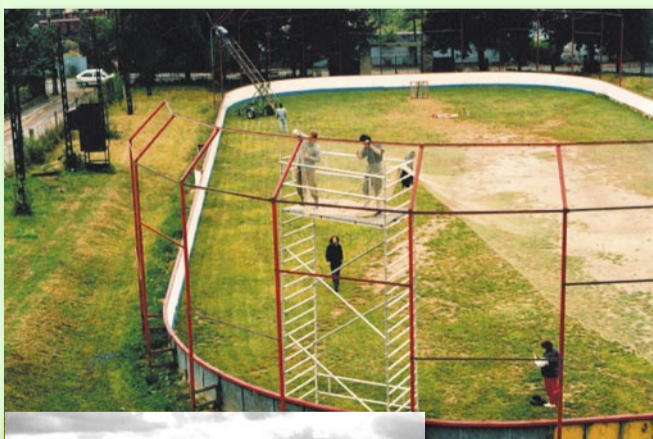
PRVNÍ PODOBA RADOTÍNSKÉ LAKROSOVÉ ARÉNY, OTVÍRALA SE NA PODZIM 2000