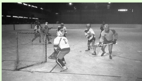
ZÁPAS S MALEŠICEMI KONCEM 80. LET V HALE NA ŠTVANICI, KTERÁ JE JIŽ JEN VZPOMÍNKA