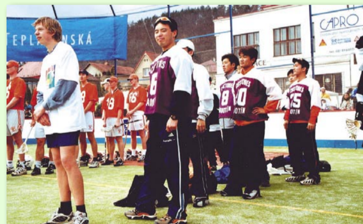
HŘAČI Z TOKIA PŘI NÁSTUPU PRVNÍHO MEZINÁRODNĚ OBSAZENÉHO TURNAJE V ROCE 2001