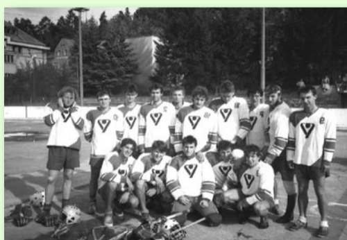
TAMTĚŽ O DVA ROKY POZDĚJI, FOCENO PO ZÁPASE