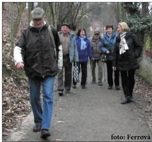
Vycházka KAAN na zbraslavský Belvedér