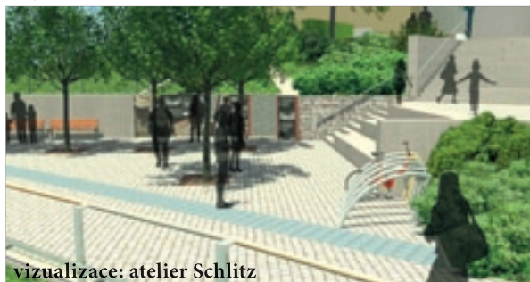
vizualizace: atelier Schlitz