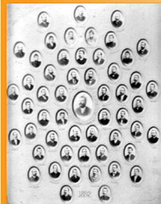
Tablo Družstva divadelních ochotníků Hálek z roku 1892