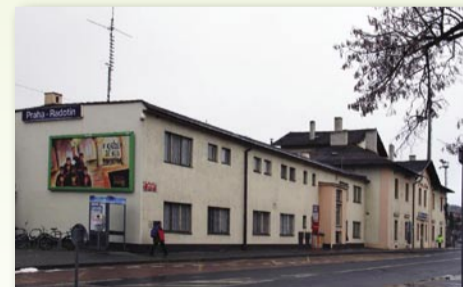
Současná podoba nádraží při pohledu z ulice... ...a z druhého nástupiště