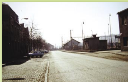
Pohlédneme od Ventilátoru po Vrážské ulice zpět k centru – takhle to u nádraží vypadalo v roce 1978

Momentka z konce války zabírá kromě nádraží (a konvoje vlasovců) i benzinovou čerpací stanicí Bří Zikmundů na dražním pozemku před čp. 204