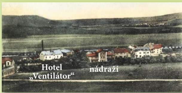
Hotel „Ventilátor“ nádraží

Pohled na obě stavby od Říháků v roce 1910 – světlá budova před továrním komínem je hotel „U ventilátoru“, uprostřed v popředí je nádraží