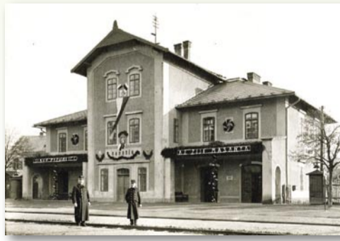
Takhle se nádraží vyšňořilo k 10. výročí vzniku republiky, stromy přímo před budovou už na tomto záběru chybí

Kolaudace polyfunkčního domu, kde dnes sídlí Český archiv vín, proběhla 10.9.2002. Schválena zde byla jak prodejna vína, tak i kancelářské prostory v 1. a 2. patře a pět malometrážních bytů v podkroví. Snímek je z 5.1.2017