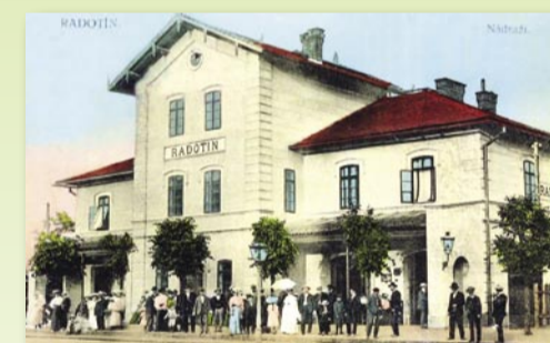
Nejstarší detailní fotografie samotného nádraží, kterou máme k dispozici, pochází však již z 28.5.1915. Zachytila stavbu starou 47 let