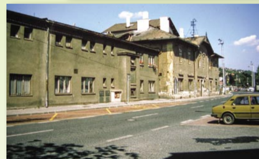
V roce 1999 celý komplex (i s přístavbou z roku 1947) ještě na svou rekonstrukci čekal, k té došlo až o jedenáct let později

Tento snímek vznikl patrně nedlouho po I. sv. válce – stromky před odbavovací budovou už značně povyroستli, zatím je však nikdo nepokácel