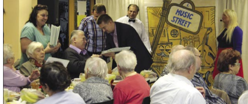
Zástupci vedení radotínské radnice s klienty pečovatelské služby