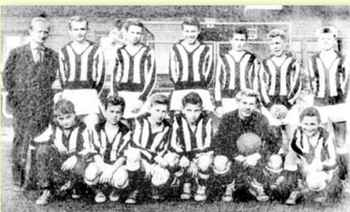
FOTBALOVÁ OMLADINA V 50. LETECH