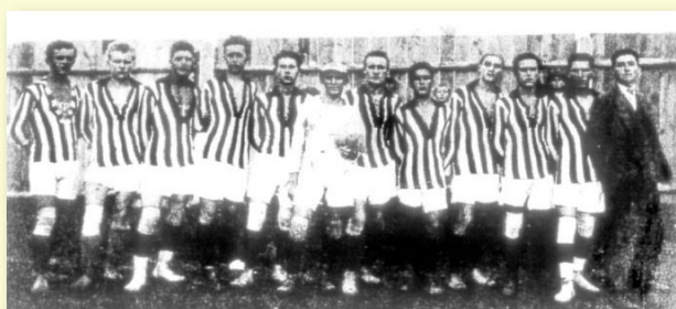
JEDNO Z PRVNÍCH MUŽSTEV RADOTÍNSKÉHO SK V ROCE 1922

V ROCE 1968 VYPADALO SAMOTNÉ HRŠTĚ STÁLE STEJNĚ, MÍRNĚ SE ROZROSTLO POUZE ZÁZEMÍ. NA STEJNÉM MÍSTĚ HRÁLI RADOTÍNSTÍ FOTBALISTÉ AŽ DO ROKU 1985, KDY ZDE VZNIKL STAVEBNÍ DVŮR DODAVATELE VÝSTAVBY V CENTRU RADOTÍNA. NA CHVÍLI SE JEŠTĚ NA ZDEJŠÍ TRÁVNÍK VRÁTILI, ALE DNES JE TU JIŽ NOVÁ SPORTOVNÍ HALA