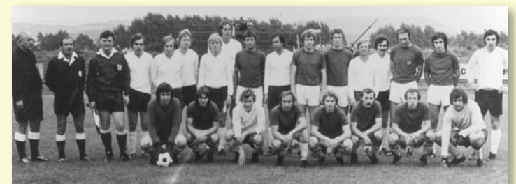
PŘÁTELSKÉ UTKÁNÍ S KOMPLETNÍ LIGOVOU SPARTOU V ROCE 1977 BĚHEM OSLAV K 65 LETŮM ZALOŽENÍ RSK