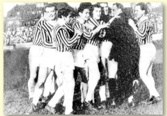
RADOST Z VÍTĚZSTVÍ (A OCHOZY BYLY PLNĚ)