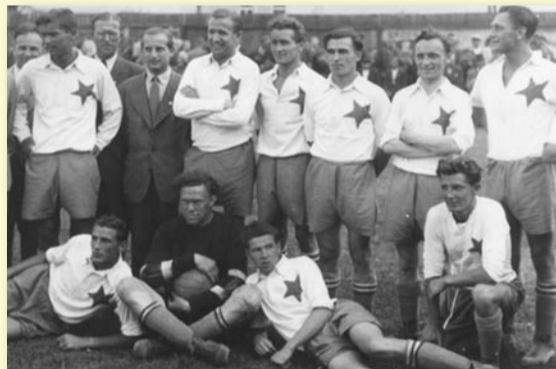
SK SLÁVIA V RADOTÍNĚ V ROCE 1945, LEGENDÁRNÍ PEPI BICAN STOJÍ VPRAVO