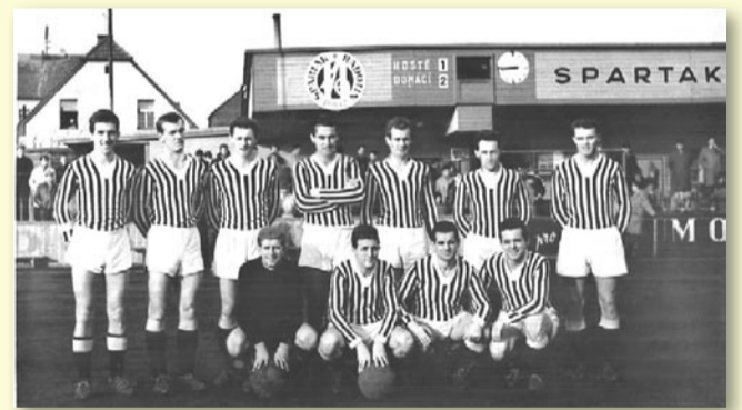
NÁVRAT DO DRUHÉ LIGY 1962-63