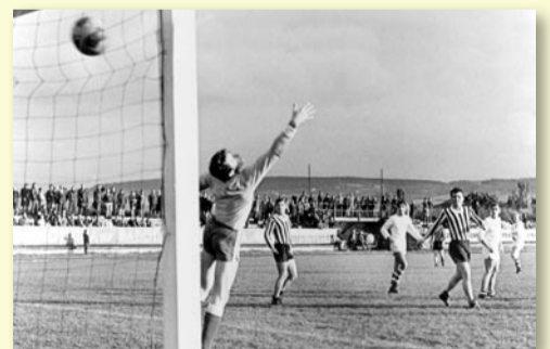
SPARTAK RADOTÍN – OLYMPIONICI ČSSR 0 : 3 (ROK 1968)