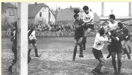
NAMÍSTO REKLAM SE NA MANTINELECH SKVĚL NÁPIS O ODKAZU JULIA FUČÍKA