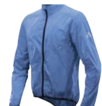
Vaude Mens Air Jacket