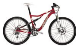
Gary Fisher Hi Fi Pro