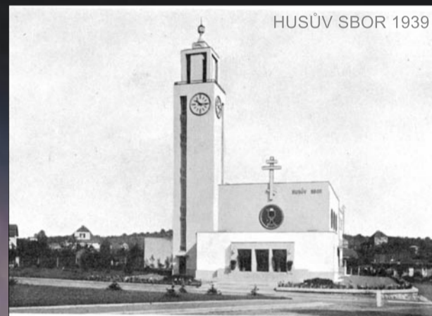
HUSŮV SBOR 1939