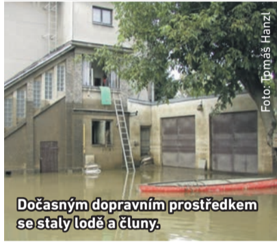
Dočasným dopravním prostředkem se staly lodě a čluny.