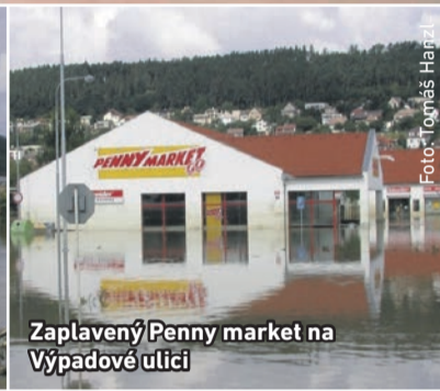
Zaplavený Penny market na Výpadové ulici