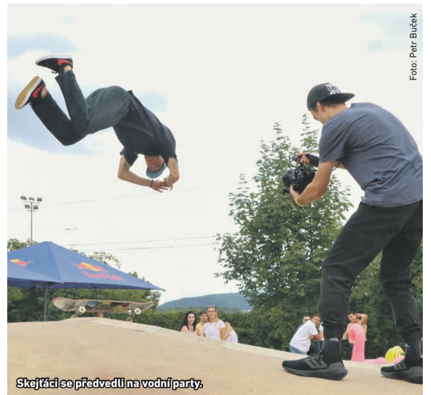
Skejtáři se předvedli na vodní party.