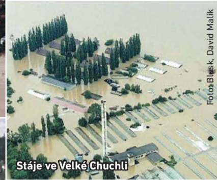
Stáje ve Velké Chuchli