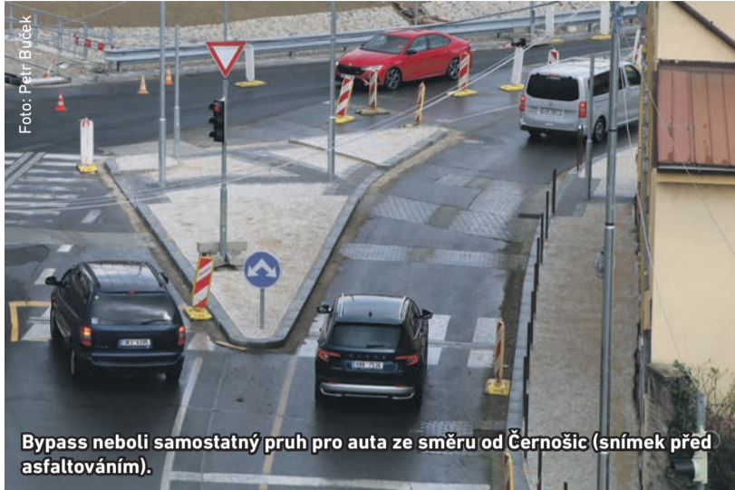
Bypass neboli samostatný pruh pro auta ze směru od Černošic (snímek před asfaltováním).

Od pátku 5. srpna bude křižovatka pod Korunou zpátky v plném provozu, skončí pokládka finálního povrchu (termín je platný k 28. červenci, kdy měly tyto noviny uzávěrku). Křižovatka s novým