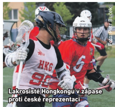
Lakrosisté Hongkongu v zápase proti české reprezentaci