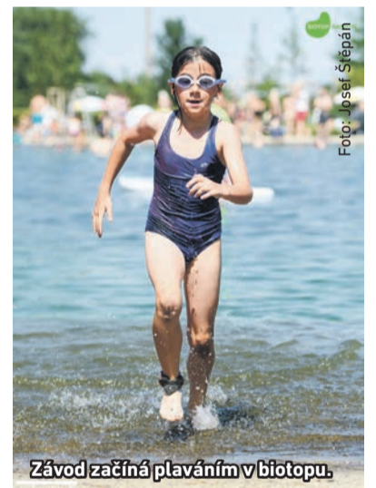
Závod začíná plaváním v biotopu.