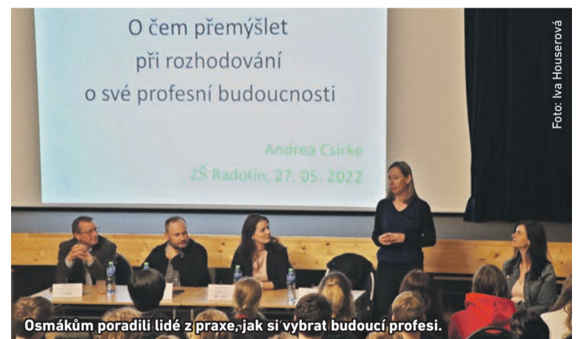
Osmákům poradili lidé z praxe, jak si vybrat budoucí profesi.

www.praha16.eu/MAP-II www.praha16vzdelava.cz