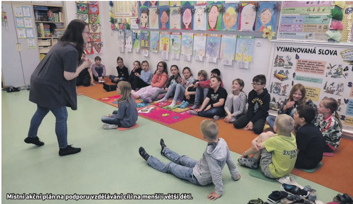
Místní akční plán na podporu vzdělávání cílí na menší i větší děti.