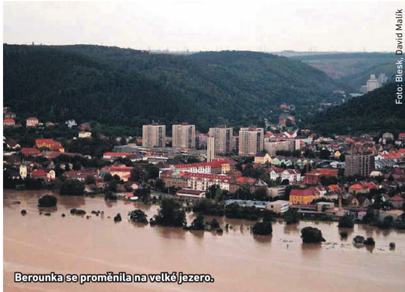
Berounka se proměnila na velké jezero.

Hloubka zatopených objektů dosahovala až ke čtyřem metrům, na Horymírově náměstí bylo 1,5 metru vody. Velmi postižená byla lokalita Šárovo kolo, která se před pár lety stejně jako další místa v Radotíně dočkala protipovodňové ochrany. ■