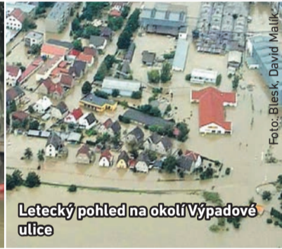
Letecký pohled na okolí Výpadové ulice