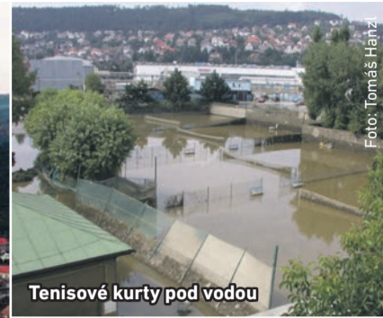
Tenisové kurty pod vodou