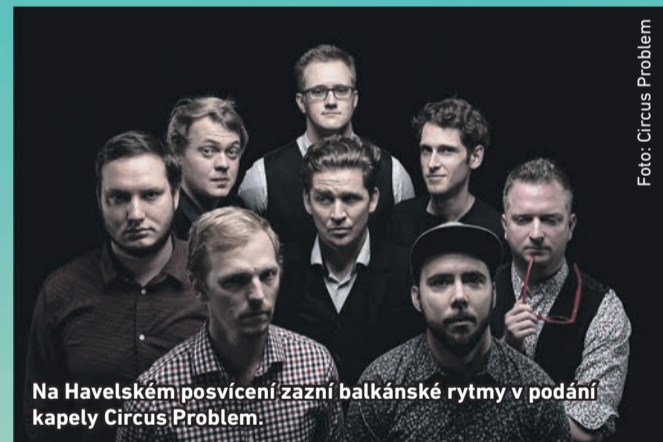
Na Havelském posvícení zazní balkánské rytmy v podání kapely Circus Problem.

Tradiční dvoudenní Havelské posvícení nabídne široký kulturní program. Sobotní večer 8. října vyvrcholí koncertem kapely Circus Problem. Její hudba je inspirovaná balkánskými rytmy. Nedělní plejáda koncertů nabídne mimo jiné Lauru a její tygry nebo hardrockovou kapelu Blastery s bývalým klávesistou Olympiku Jiřím Valentou.