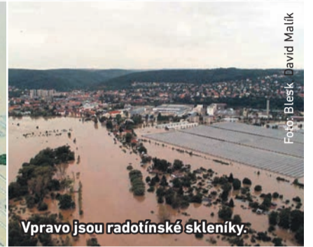
Vpravo jsou radotínské skleníky.