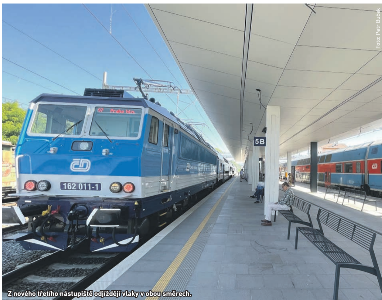
Z nového třetího nástupiště odjíždějí vlaky v obou směrech.

V červenci uplynulo 160 let od příjezdu prvního vlaku do Radotína, na září se chystají oslavy tohoto výročí. Zároveň se přiblížil konec hlavních prací na trati, v prosinci se cestující dočkají tří moderních nástupišť a dvou bezbariérových podchodů.