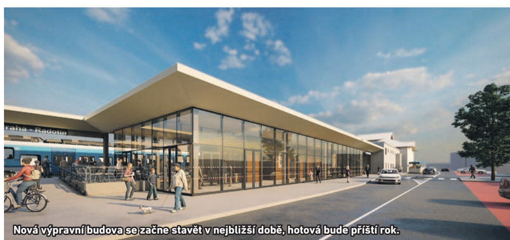
Nová výpravní budova se začne stavět v nejbližší době, hotová bude příští rok.