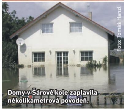
Domy v Šárově kole zaplavila několikametrová povodeň.