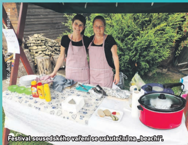
Festival sousedského vaření se uskuteční na „beachíř“.

Oblíbená akce milovníků dobrého jídla a vášnivých amatérských kuchařů se uskuteční v sobotu 3. září v Beach Aréně. Milovníci dobrého jídla se mohou těšit na speciality z různých koutů světa a nasát příjemnou atmosféru za doprovodu živé hudby. Sousedé i tentokrát připraví své speciality a pořadatelé se moc těší na nové tváře mezi kuchaři. Kdo chce navařit pro ostatní, může se se svými gastro nápady hlásit do poloviny srpna pořadatelům na telefonním čísle 722 191 838 nebo e-mailem: terkadvorackova@gmail.com.