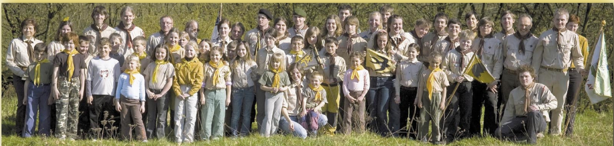
Výroční foto Oraganu pořízené k 20. výročí znovobjevené činnosti

Od 18. dubna do 8. května probíhala ve Sluneční klubovně v Žabovřeské 1227 obsáhlá výstava věnovaná posledním 20 letům - od chvíle obnovení činnosti Oraganu