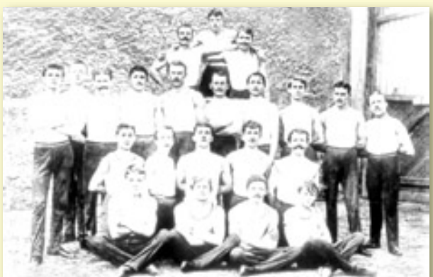
I TENTO SNÍMEK BYL POŘÍZEN V DOBĚ PŘED PRVNÍ SVĚTOVOU VÁLKO