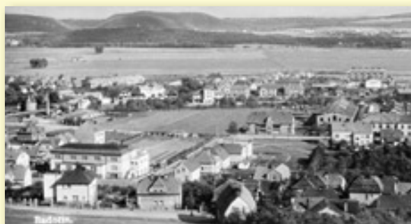
TAK VYPADAL VE TŘICÁTÝCH LETECH HORNÍ POHLED NA NOVOU SOKOLOVNU, KTERÁ SE VEDLE VELKÉHO SÁLU A RESTAURACE PYSNILA I ROZSÁHLÝM VENKOVNÍM AREÁLEM