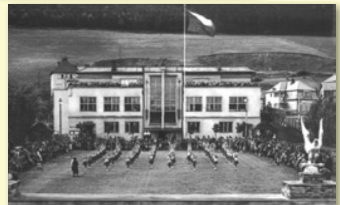
ROK 1938, CVIČÍ DÍVKY A OCHOZY JSOU PLNĚ