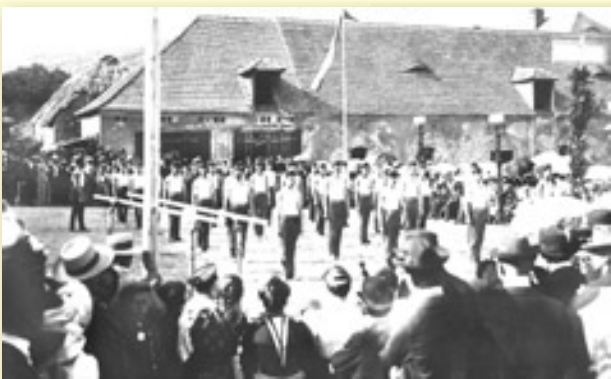
PRVÝM LETNÍM CVIČIŠTĚM BYL VEDLE ZAHRADY HOSTINGE U ČESKÉ KORUNY TAKÉ PROSTOR ZA STODOLOU DRCHOTOVA STATKU. TATO FOTOGRAFIE JE Z ROKU 1908