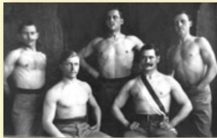
DRUŽSTVO TĚŽKÝCH ATLETŮ Z ROKU 1915