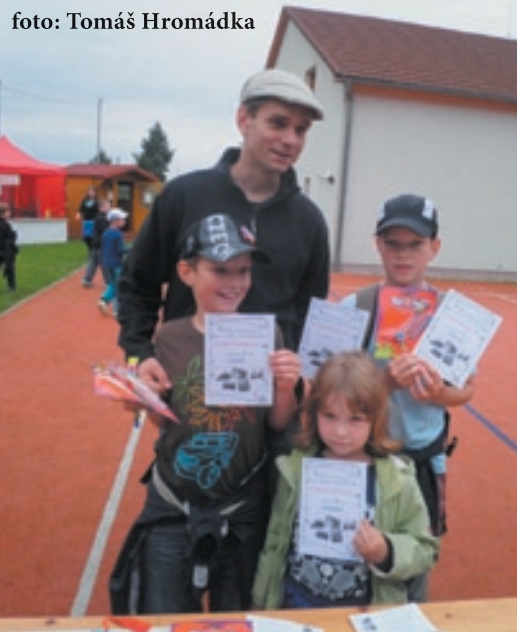
Úspěšní řešitelé velké hry „Za věžemi v okolí Chuchle“