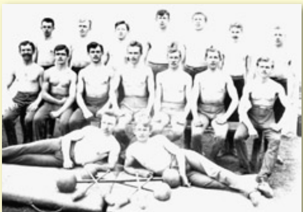
MUŽI SOKOLA RADOTÍNSKÉHO V ROCE 1914