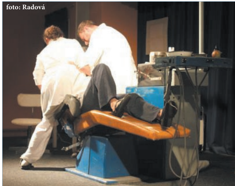
Kladenští „zubaři“ se tentokrát změní v „televizáky“

Kladenské divadlo V.A.D. tentokrát nebude vrtat do zubů, ale bude (se) vrtat v prostředí jedné fiktivní soukromé televizní stanice.