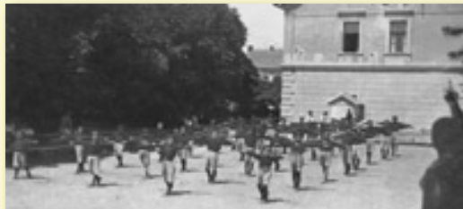
V ROCE 1928 BYLA ZŘÍZENÁ PRVNÍ TĚLOCVIČNA V BÝVALÉM CUKROVARU, V TZV. ELEKTŘÁRENSKÉM SVAZU. SNÍMEK MALÝCH CVIČENCŮ NA PŘILEHLÉM LETNÍM CVIČIŠTI POCHÁZÍ Z ROKU 1931