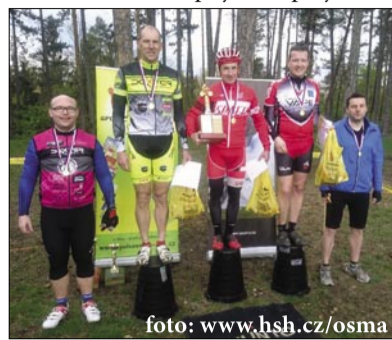
Stupně vítězů Zbraslavské osmy

Ten den zatažená počasí hrozilo občasnými přeháňkami, a tak někteří zájemci ke své škodě zůstali doma. Počasí se nakonec příjemně projasnilo