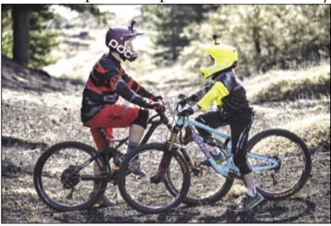
Pózování v bezpečnějším terénu

činku v základním táboře Zafferana se podařilo přiblížit vrcholu Etny