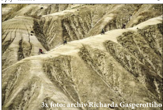
Sjet aktivní sopku chce odvalu

Konečně! Splněno... tři sopky – a hlavně bez zranění!