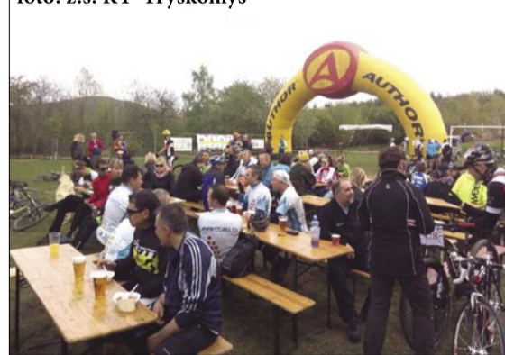
Cukroušův mazec v cíli

vodníky, kteří chtěli zažít atmosféru závodu, byla připravena „open jízda“ v délce 20km s převýšením 400 m. Přesto, že se jedná stále o „novinku“, našlo se pár odvážlivců, kteří tuto trasu absolvovali.