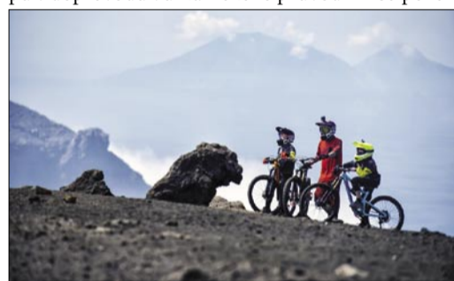
Trio odvážlivců rozvažuje cestu

Na nejvyšší bod ostrova Stromboli, vrchol Vancori 924 m.n.m., se kluci dostali po takřka tříhodinovém výstupu v doprovodu vulkanického průvod-