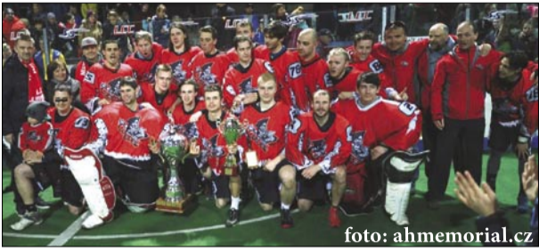
Vítězný tým Memoriálu Aleše Hřebeského 2017 - LC Custodes Radotín

Domácí radotínský tým ale neměl cestu k titulu lehoukou. Svou skupinu, v níž se utkal i se svým finálovým soupeřem, sice bez problémů vyhrál a v osmifinále přešel před Istanbul Sultans, ale pak ho čekalo opakování loňského finále proti týmu z Alerty. V atraktivním zápase radotínští