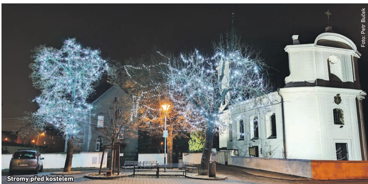
Stromy před kostelem