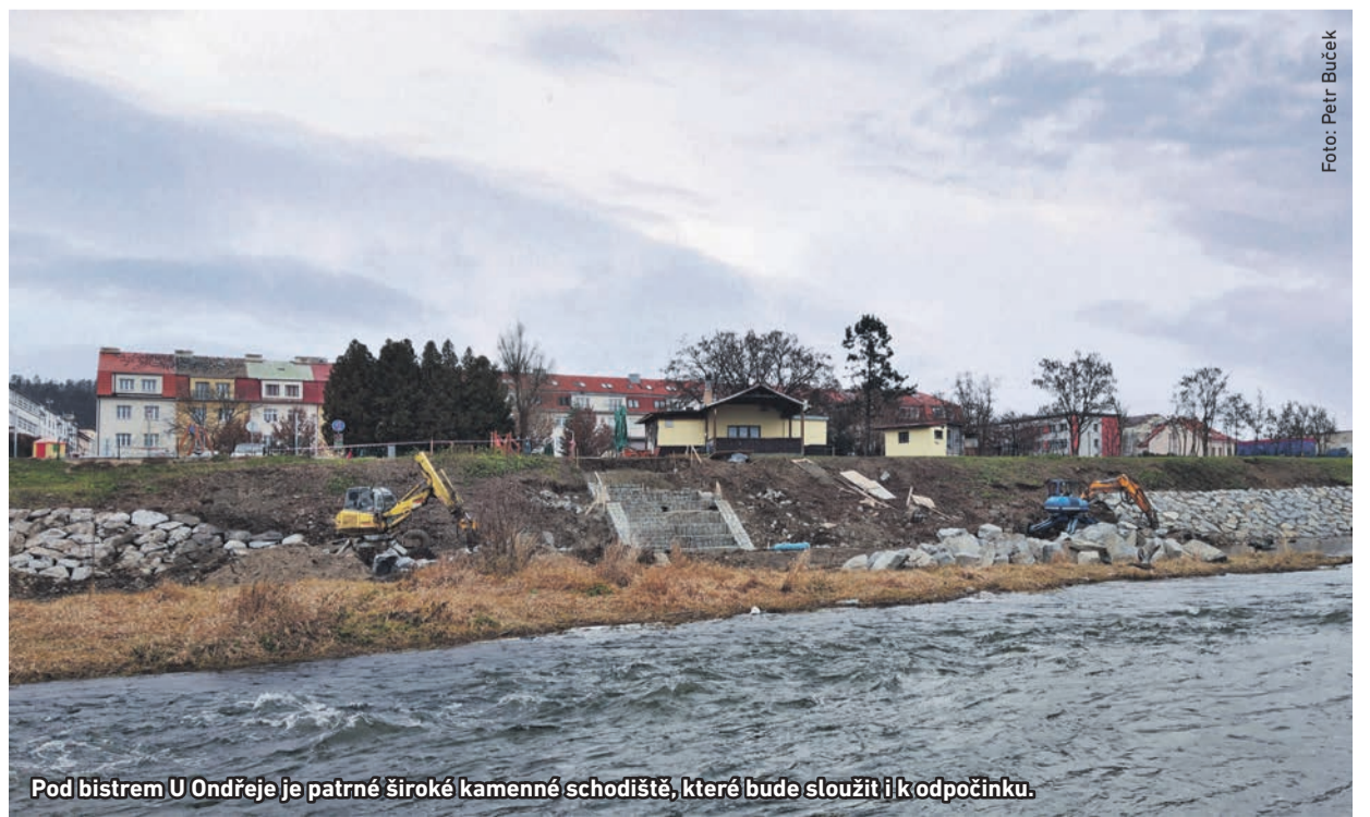
Pod bistem U Ondřeje je patrné široké kamenné schodiště, které bude sloužit i k odpočinku.