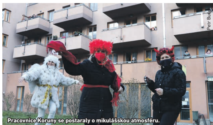
Pracovnice Koruny se postaraly o mikulášskou atmosféru.