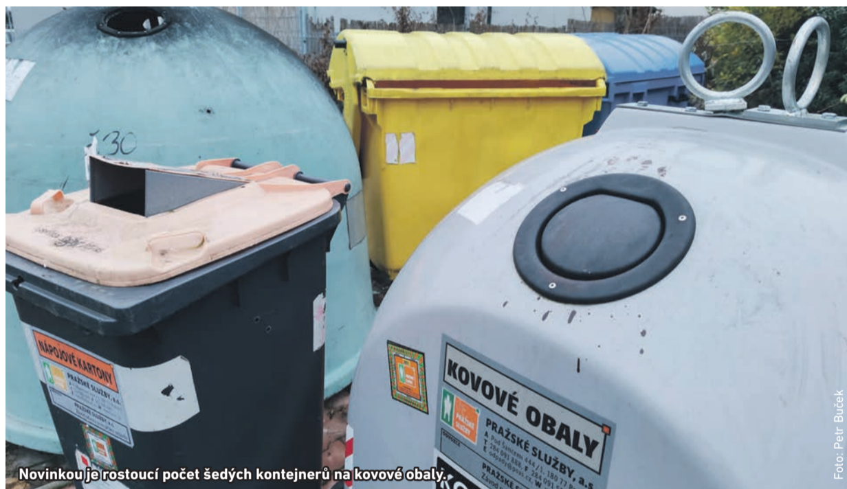
Novinkou je rostoucí počet šedých kontejnerů na kovové obaly.

Do radotínského sběrného dvora nedávno přivezli úplně nový sprchový kout, kterého se majitel chtěl zbavit. Jindy zase zaměstnanci technických služeb musí společně s hasiči likvidovat odložené sudy s olejem u kontejnerů na plasty a papír.