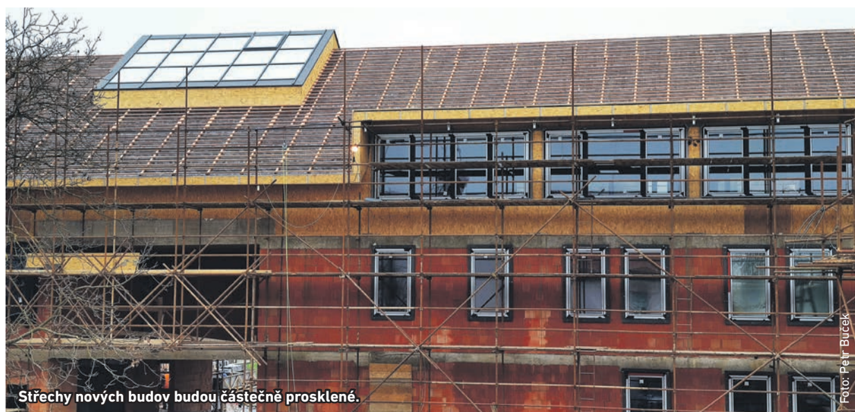
Střechy nových budov budou částečně prosklené.