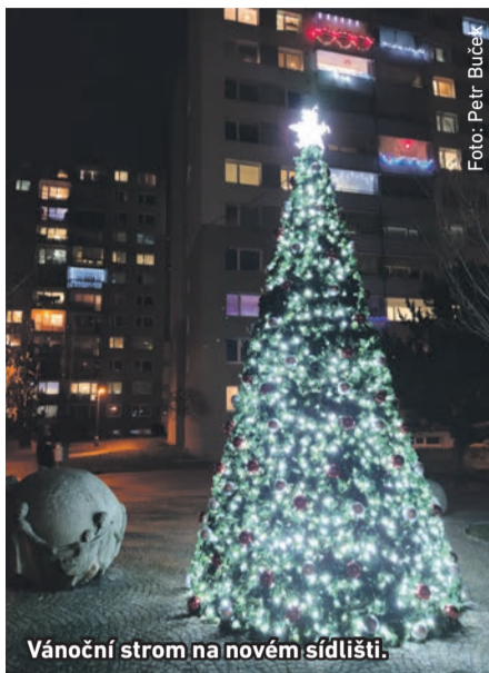
Vánoční strom na novém sídlišti.