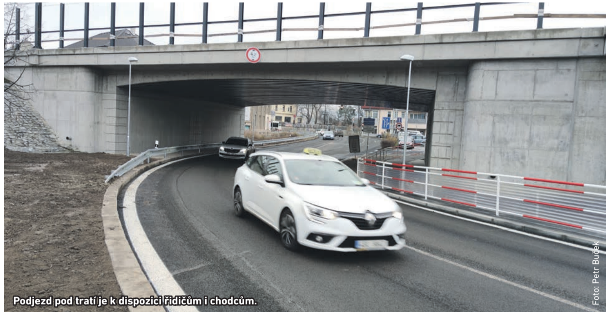
Podjezd pod tratí je k dispozici řidičům i chodcům.