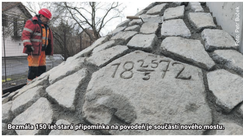
Bezmála 150 let stará připomínka na povodeň je součástí nového mostu.