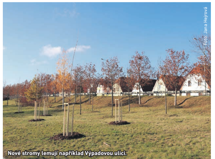
Nové stromy lemují například Výpadovou ulici.