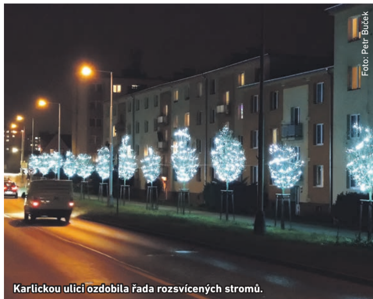
Karlickou ulici ozdobila řada rozsvícených stromů.