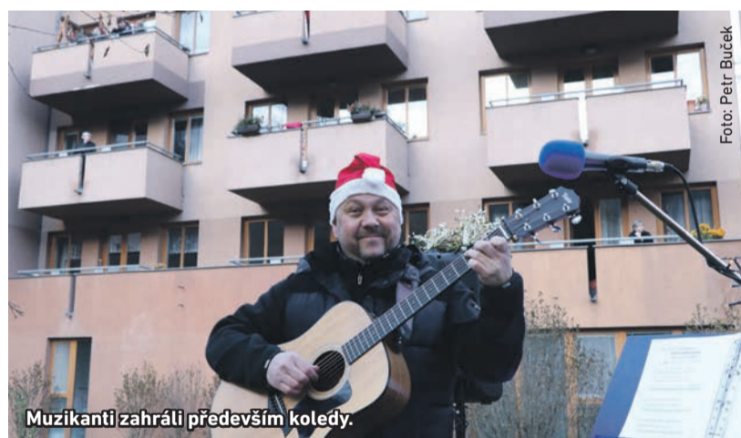
Muzikanti zahráli především koledy.