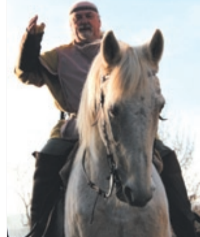
Takhle slavný vладыka loni zdravil Radotín

Horymírova jízda - v sobotu 1. března mezi čtvrtou a pátou hodinou na náměstí Sv. Petra a Pavla