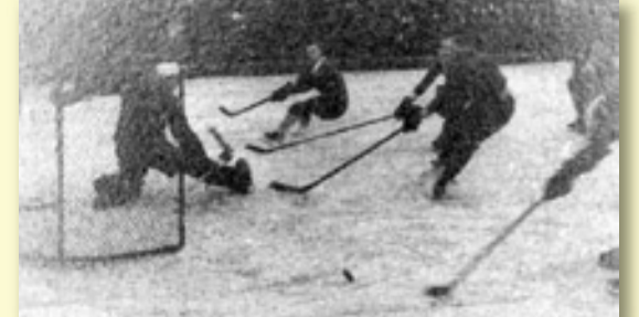
TAHLE PODÍVANÁ JE UŽ V RADOTÍNĚ MINULOSTÍ. ŠKODA, I Z VÍCE NEŽ PADESÁT LET STARÉHO A NEPŘÍLIŠ ZACHOVANÉHO SNÍMKU SÁLÁ ENERGIE A NADŠENÍ HRÁČŮ, KVŮLI KTERÝM SE PLNILY OCHOZY

text: Kateřina Drmllová