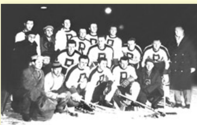
HOKEJISTÉ SPARTAKU NA HRŠTI PŘED SOKOLOVNOU V ROCE 1958