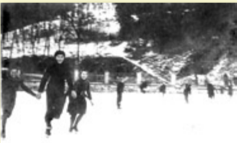
VEŘEJNÉ BRUSLENÍ SE V RADOTÍNĚ POŘÁDALO NEJPRVE NA NÁDRŽI BÖHMOVA MLÝNA (DNES AREÁL ZEMĚDĚLSKÉHO UČILIŠTĚ), TADY SBÍRALI PRVNÍ ZKUŠENOSTI I BUDOUCÍ HOKEJISTÉ

V ROCE 1953 BYLA VEŠKERÁ TĚLOVÝCHOVA V RADOTÍNĚ SLOUČENA POD TJ SPARTAK RADOTÍN, TEHDY SE PRO HOKEJ UPRAVOVALO CVIČIŠTĚ PŘED SOKOLOVNOU. TRÉNINKOVÉ OBDOBÍ BYLO ZÁVISLÉ ČISTĚ NA PŘÍZNÍ POČASÍ, COŽ ZDE VÝVOJ TOHOTO SPORTU UTLUMOVALO. POPRVÉ ODDÍL LEDNÍHO HOKEJE ZANIKL V ROCE 1964. O ČTYŘI ROKY POZDĚJI SE OPĚT PODAŘILO SESTAVIT DRUŽSTVO DOSPĚLÝCH, STÁRNOUCÍ INVENTÁŘ A NEDOSTATEČNÁ PODPORA VŠAK POSTUPNĚ USPALY RADOTÍNSKÝ LEDNÍ HOKEJ NADOBRO.