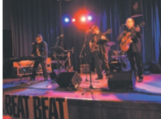
Na akci podpořené Městskou částí Praha 16 nechyběl ani Olympic