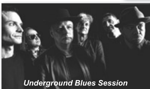
Underground Blues Session

A pozor – žena, která nepřijde, nedostane květinu! -kd-