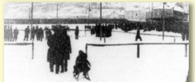
HOKEJOVÝ TÝM RSK NA DOMÁCÍM HRŠTI V ROCE 1946