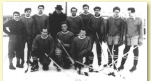
JEŠTĚ STÁLE NA STARÉM HRŠTI