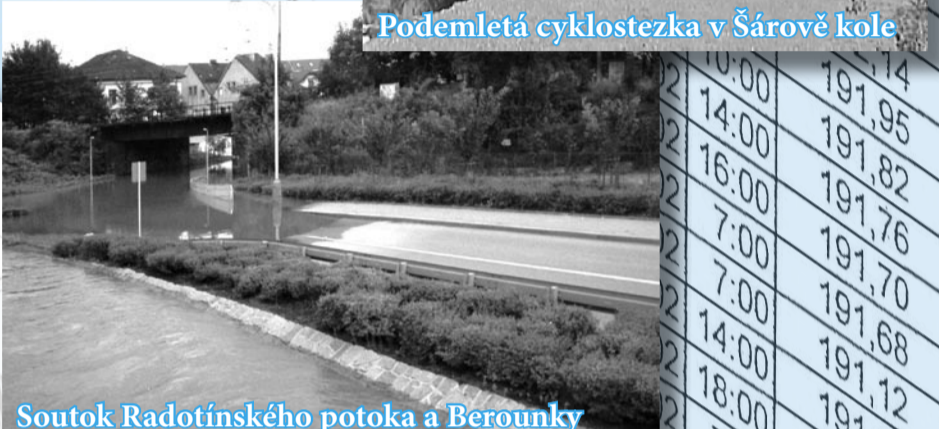
Soutok Radotínského potoka a Berounky