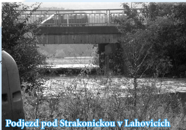
Podjezd pod Strakonickou v Lahovicích

Obyvatelstvo bylo varováno sirénami, hlášením městského rozhlasu a megafony z mobilních prostředků. Po výzvěch byla 12. srpna zahájena evakuace občanů v ohrožených oblastech.