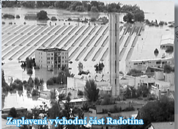
Zaplavená východní část Radotína

Nejvíce, 26 ulic, bylo zaplaveno na Zbraslavi a Lahovicích