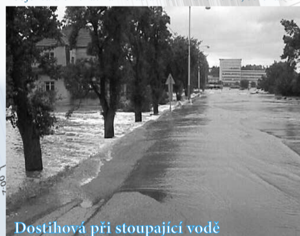
Dostihová při stoupající vodě