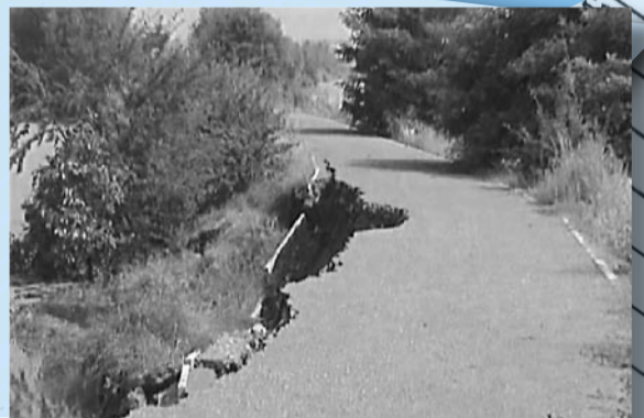
Podzemní cyklostezka v Šárově kole