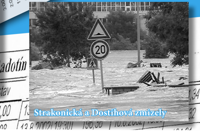
Strakonická a Dostihová zmizely