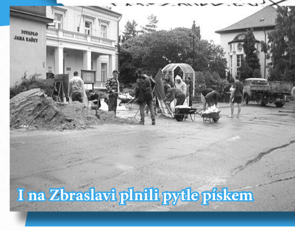
I na Zbraslavi plnili pytle pískem