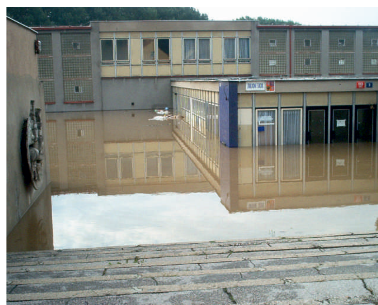
Základní škola patřila v srpnu 2002 k povodni nejvíce zasaženým objektům v Radotíně