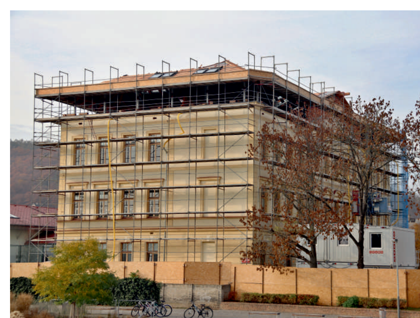
Poslední patro historické budově základní školy z roku 1901 přibýlo v letech 2018–2019