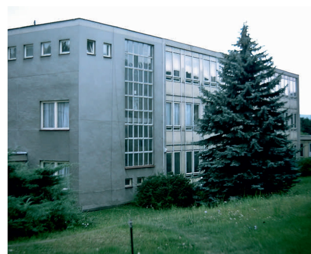
2. stupeň základní školy před čtyřmi desítkami let

Druhá budova základní devítileté školy byla otevřena v roce 1969 v Loučanské ulici, byla a dosud je určena pro třídy 2. stupně. Po povodních v roce 2002 prošla celkovou rekonstrukcí a následně několika etapami rozšíření a dostavby pavilonů včetně nové auly. V roce 2019 se dočkal rozšíření tříd a nástavby historické budovy z roku 1901 i první stupeň základní školy zde na náměstí Sv. Petra a Pavla.