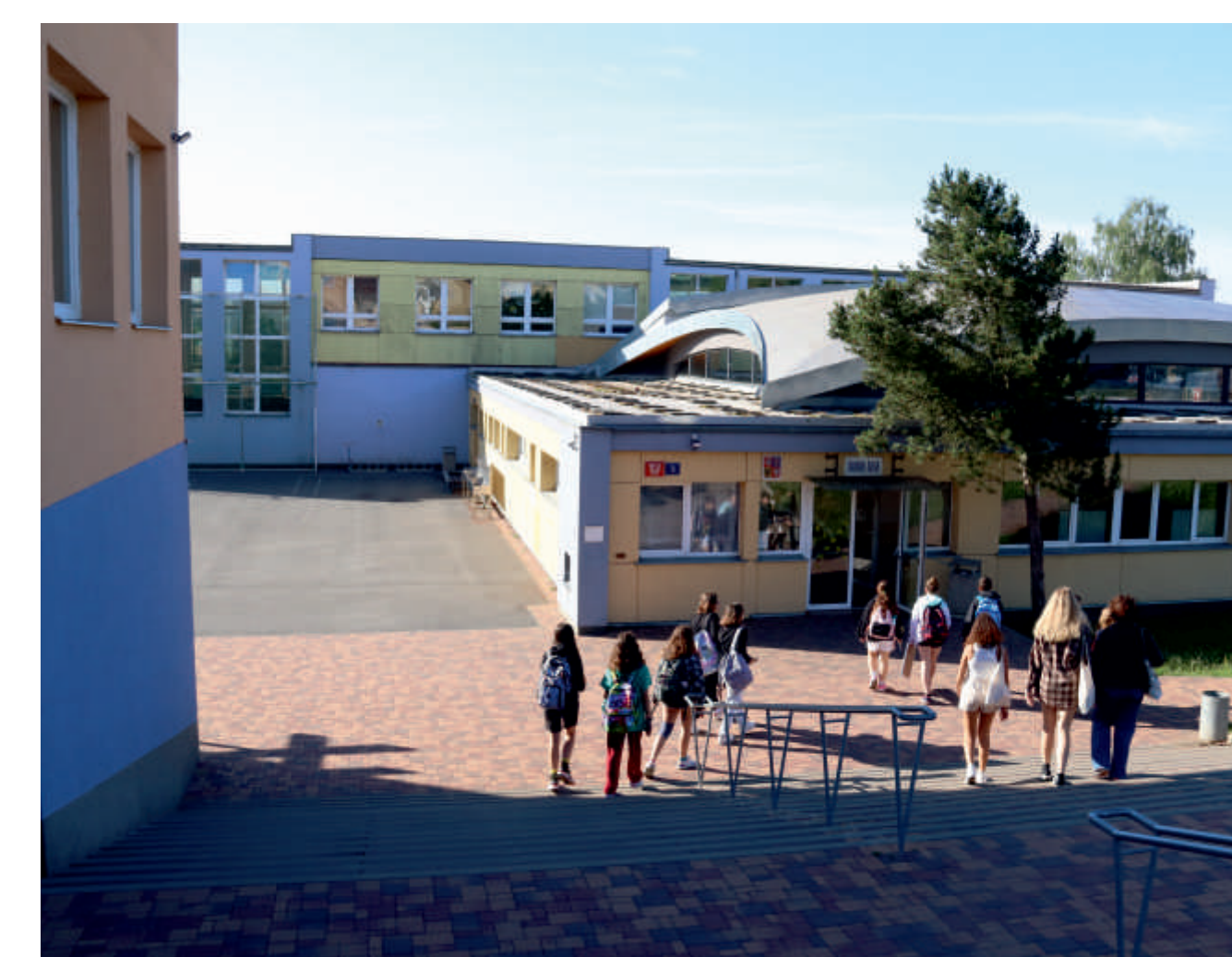
Kompletně opravený a dostavěný areál byl v roce 2018 rozšířen o moderní víceúčelovou aulu