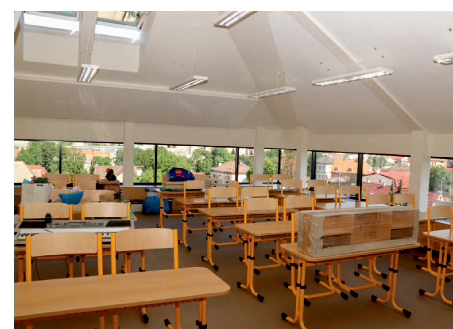
Nabízí nejen zcela netradiční podobu školní třídy, ale také mimořádné výhledy na Radotín