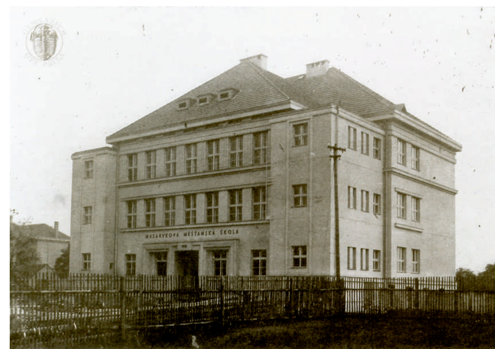
Dnešní gymnázium svou vnější podobu z roku 1928 prakticky nezměnilo...