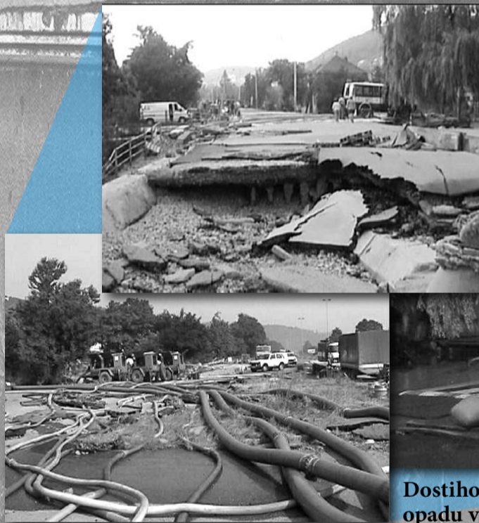
Dostihová ulice v Chuchli po opadu vody