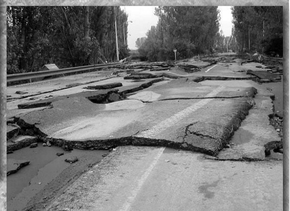
„Asfaltové kry“ v ulici K Přehradám