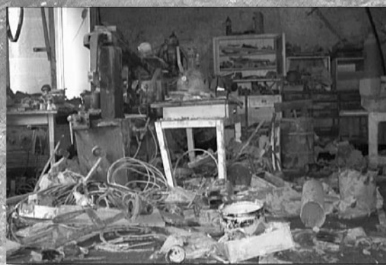
Uvnitř jednoho z domů ve Vypadové ulici