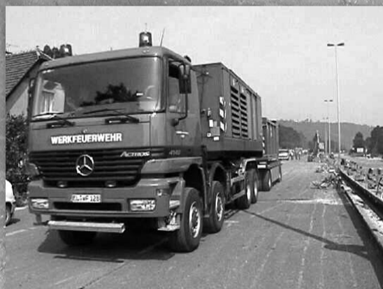
I zahraniční hasiči se podíleli na pomoci (Velká Chuchle)