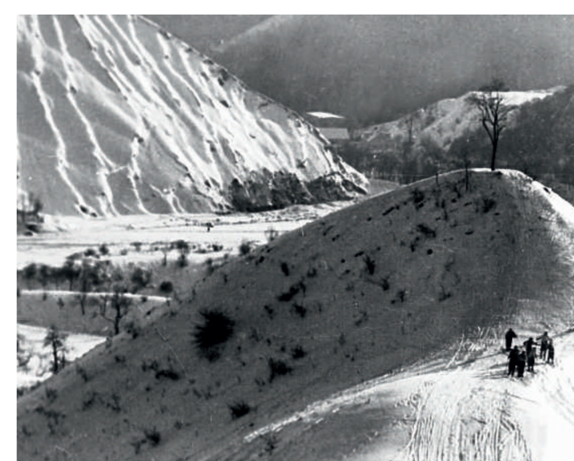
Lyžování na Homolce