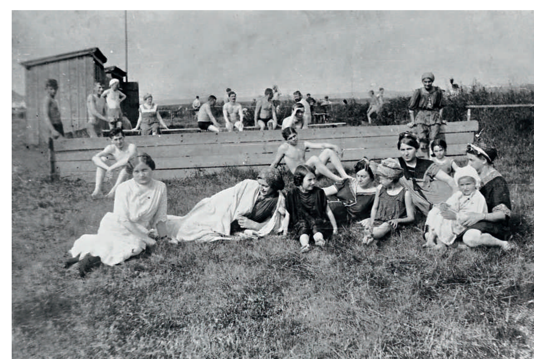
1935: pohoda, klid, koupání, relaxace