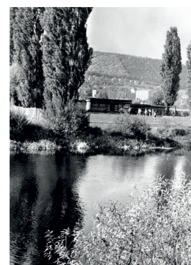
Lázně v roce 1950...