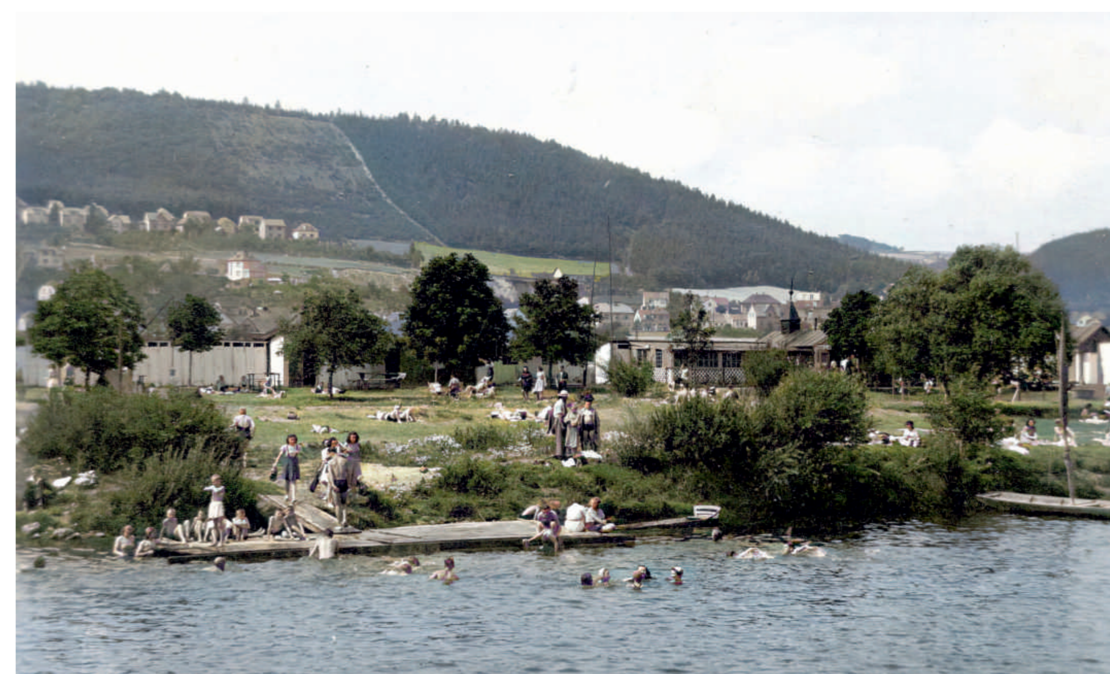
Říční lázně 1930

Říční lázně poskytovaly v nádherné přírodě klid, relaxaci, sportovní vyžití, výtečnou kuchyni i zábavu na březích stříbrné Berounky.