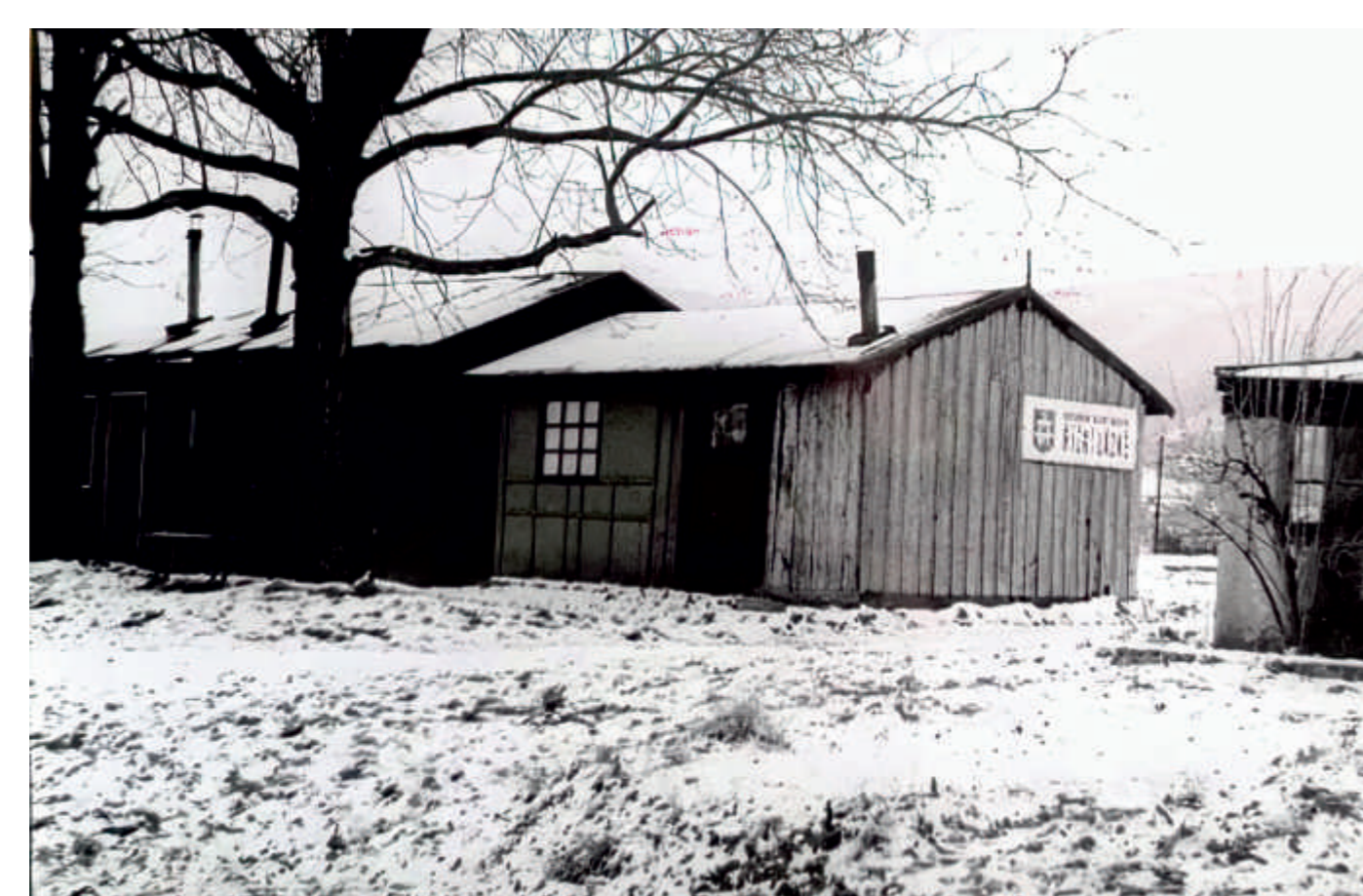
...a chátrající o 20 let později