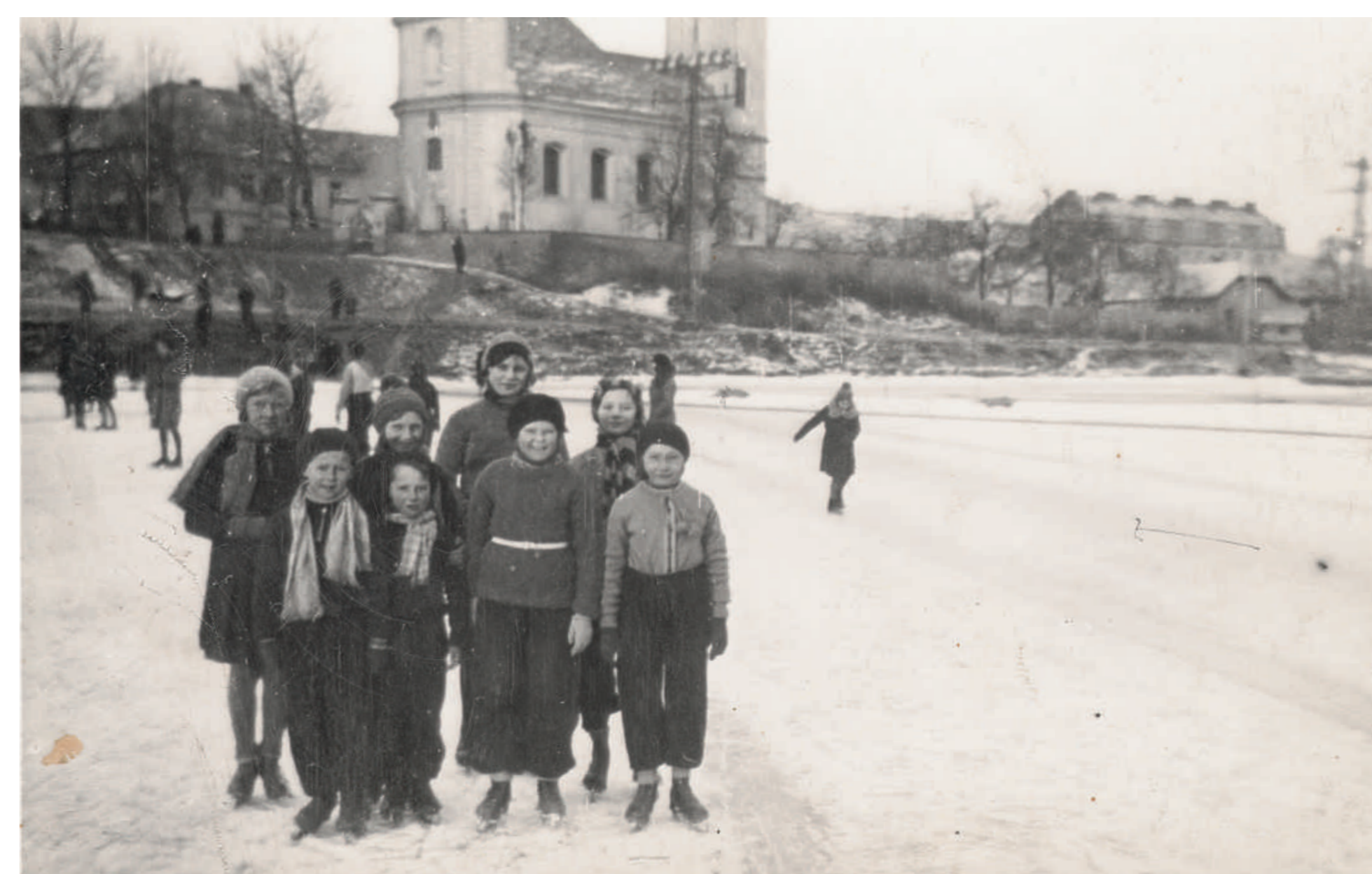
Bruslení na Berounce pod kostelem (1932)

Radotín a jeho okolí poskytuje další skvělé možnosti pro turistiku, cykloturistiku, houbaření, rybolov a třeba kanoistiku v létě. V zimě se i dnes stále dá lyžovat a sáňkovat ve Slavičím údolí, nebo bruslit v Šárově kole.