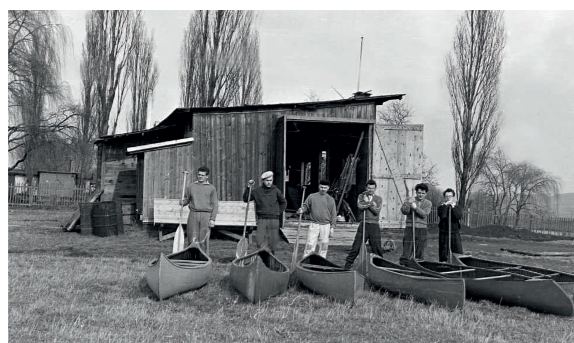
Vodácký oddíl Radotín (ve zkratce VOR) si v 50. letech v prostoru lázní zřídil klubovnu