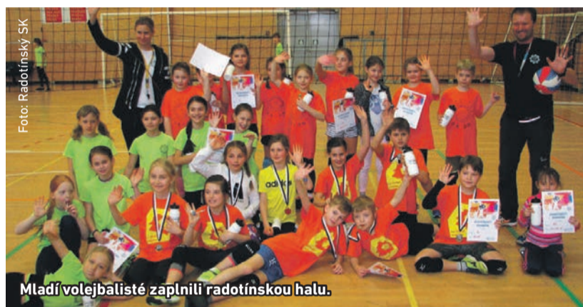
Mladí volejbalisté zaplnili radotínskou halu.

R adotínský volejbalový oddíl uspořádal na začátku března jednu ze svých doposud největších akcí, turnaj Duháček. Halu v Radotíně naplnilo okolo 150 mladých sportovců, aby porovnali svůj volejbalový um v nabitě konkurenci ostatních týmů z Prahy a Středočeského kraje. Kromě domácího Radotínského SK dorazili zástupci oddílů Lvi Praha, Orion Modřany, TJ Vršovice, TJ Kometta, Sokol Jílové a Sokol Dobřichovice.