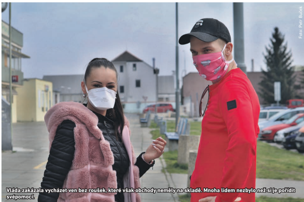
Vláda zakázala vycházet ven bez roušek, které však obchody neměly na skladě. Mnoha lidem nezbylo než si je pořídit svépomocí.

Obavy ze šířící se nákazy novým druhem koronaviru změnilы během března život v Radotíně stejně jako v celém Česku k nepoznání. Nejdříve se zavřely školy, Kulturní středisko U Koruny, kino, sportoviště a poté také bazén, knihovna, školka, mnoho obchodů i restaurace. Vláda nakonec zakázala volný pohyb osob. Lidé zůstali doma v karanténě, cestovat bylo možné jen za prací, k lékaři a na nezbytné nákupy především potravin či léků.