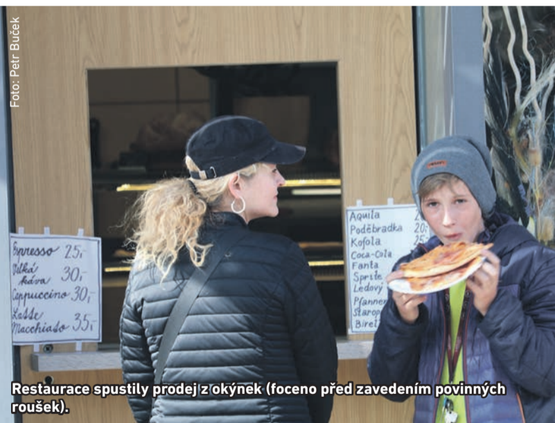
Restaurace spustily prodej z okýnek (foceno před zavedením povinných roušek).