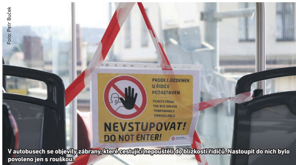
V autobusech se objevily zábrany, které cestující nepouštěli do blízkosti řidičů. Nastoupit do nich bylo povoleno jen s rouškou.