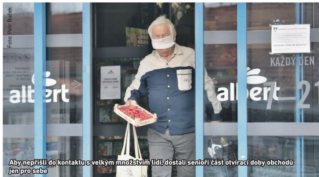
Aby nepřišli do kontaktu s velkým množstvím lidí, dostali senioři část otvírací doby obchodů jen pro sebe