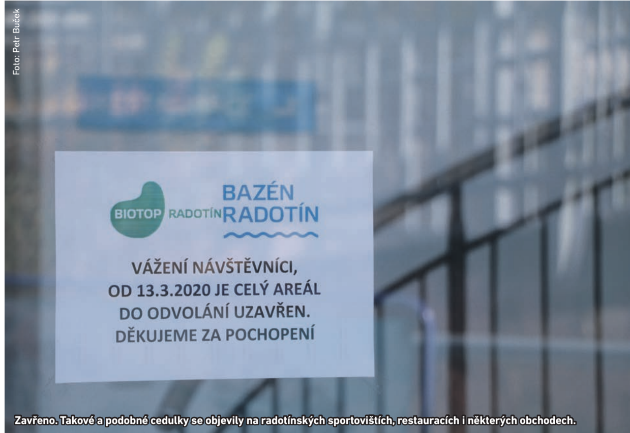
Zavřeno. Takové a podobné cedulky se objevily na radotínských sportovištích, restauracích i některých obchodech.