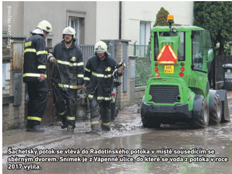
Šachetský potok se vlévá do Radotínského potoka v místě sousedícím se sběrným dvorem. Snímek je z Vápenné ulice, do které se voda z potoka v roce 2017 vylila.

Do té doby Povodňová komise městské části Praha 16 věnuje problematickému místu zvýšenou pozornost – zvláště v současném období, kdy kvůli přivalovým deštům hrozí bleskové povodně. Koryto v blízkosti ústí Šachetského potoka radotínských technických služeb vyčistily a zbavily