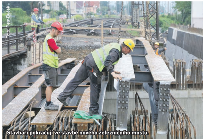
Stavbaři pokračují ve stavbě nového železničního mostu.

N ová část železničního mostu u Horymírova náměstí už dostala železnou konstrukci a betonové opěrné zdi. Provoz vlaků pokračuje po staré koleji nadjezdu nad uzavřenou silnicí. Na konci července dojde k uzavření tunýlku pro pěší u restaurace Rozmarýn. Překonat železnici tak bude možné po přejezdu anebo podchodem za sportovní halou. Po dokončení nového mostu letos na podzim budou pěší podcházet trať i po novém chodníku vedle vozovky pod železnici.