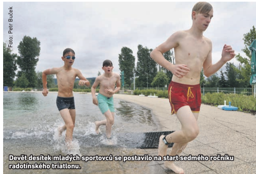
Devět desítek mladých sportovců se postavilo na start sedmého ročníku radotínského triatlónu.

N a radotínském biotopu se v půlce června konal sedmý ročník triatlonových závodů pro mladé sportovce od osmi do 15 let. Na start se postavilo devět desítek závodníků, kteří nejprve plavali, poté nasedli na kola a vydali se kroužit po přilehlých cyklostezkách a nakonec se pustili na běžecké okruhy v areálu přírodního koupaliště.