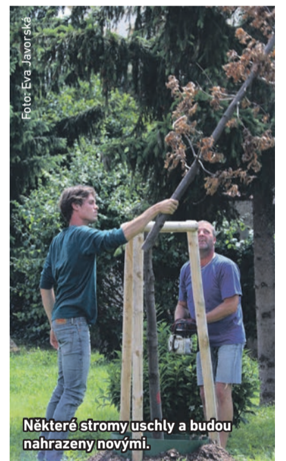
Některé stromy uschly a budou nahrazeny novými.