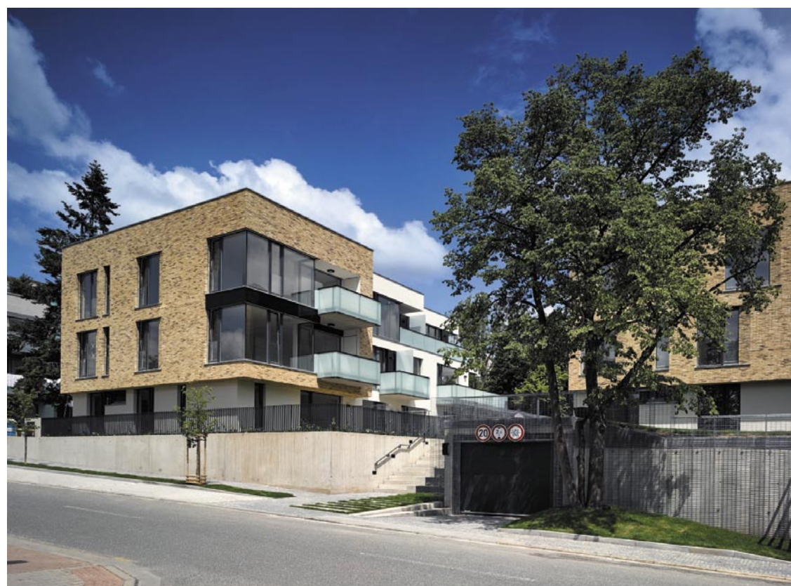
Residence Černošice: viladomy Františka a Emilie v Černošicích. Výherce prestižní soutěže Best of Realty 2016 v kategorii rezidenčních projektů do 25 bytů.

Projekty byly hodnoceny devítičlennou odbornou porotou, v níž sedí realitní porotci, zástupci profesních sdružení, ale i bankéři považováni v tuzemsku za nejprestižnější v oboru. Projekty jsou posuzovány z více hledisek. Z hlediska lokality, architektonického řešení, kvality stavebních prací, urbanistického řešení a úspěšnosti projektu na trhu. Všech 20 bytů Residence Černošice bylo rozprodáno pár týdnů po kolaudaci.