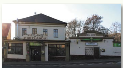
U Portlandu dnes – současná majitelka nechala roku 1997 rekonstruovat ústřední vytápění, které v roce 1965 zavedly Restaurace a jídelny okresu Praha – západ, a zavést plyn. Vznikla zde vinárna a roku 2013 i herna