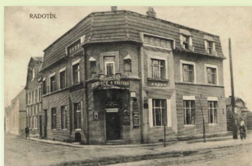
Tento záběr je z doby, kdy bylo domu sedm let