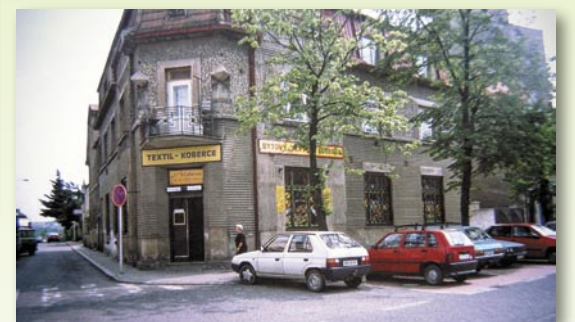
V roce 2000 se zde prodávaly koberce, ale změn dům doznal již dříve – v roce 1939 v něm byla prodejna Bratrství a podle záznamu ze 14.6.1954 urgoval Místní národní výbor Státní spořitelnu: „Při této příležitosti konstatováno, že vzhled Vašich úradoven zvenku není dobrý a bylo by dobré provésti patřičné úpravy hlavně vchodu do spořitelny a pak oken tak, aby bylo zjevné, že se jedná o peněžní ústav“