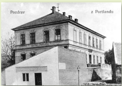
Pohlednice, rovněž z roku 1914, zaznamenala pohled na dům ve směru od potoka. V domku pod hostincem měla prodejnu Akciová společnost Radlická mlékárna