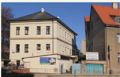
Stejný pohled ze současnosti