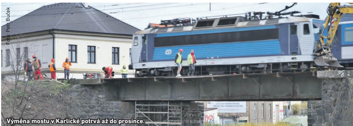
Výměna mostu v Karlické potrvá až do prosince.