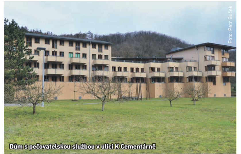
Dům s pečovatelskou službou v ulici K Cementárně

Pečovatelství domu pomáhají také radotínští dobrovolníci. Na starost si vzali část úklidů v pečovatelském domě a některé nákupy pro seniory. Rozvoz obědů převzali pod svá křídla pracovníci technických služeb.