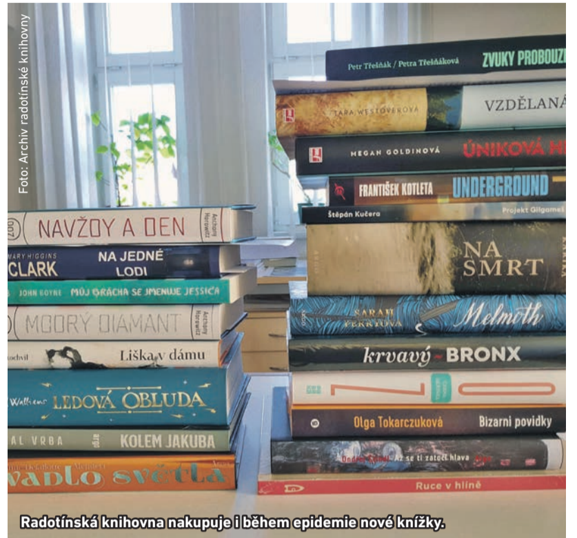
Radotínská knihovna nakupuje i během epidemie nové knížky.

V knihovně se pracuje i v koronavirovém čase, kdy je pro čtenáře zavřená. „Knihovnice využívají čas na údržbu, na opravy opotřebovaných knih, balení do ochranných fólií, případně lepení vypadaných listů z výtisků, které nechceme ztratit a na trhu již nejsou k dostání,“ říká Irena Farníková, vedoucí radotínské knihovny. Spolu s kolegyněmi vybírají knihy, které již dosloužily, nemají čtenáře, jsou příliš rozbité či zastaralé. „Samozřejmě nemůžeme zapomenout na nákup nové literatury, těšíme se na nával zájemců, až budeme moci knihovnu znovu otevřít, a pečlivě vybíráme novou četbu, kterou své čtenáře zásobíme,“ slibuje Irena Farníková.