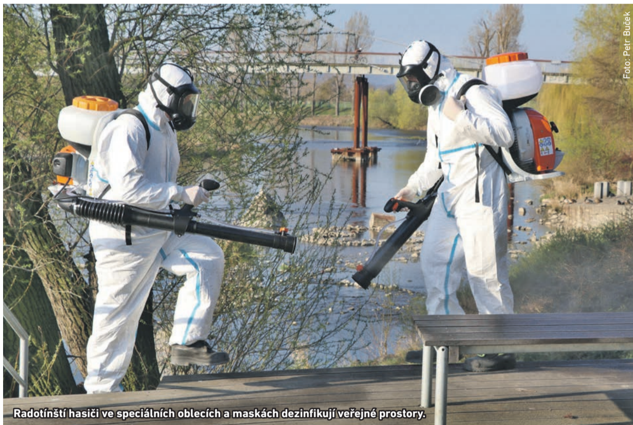
Radotínský hasič v speciálních oblečcích a maskách dezinfikuje veřejné prostory.

Už více než měsíc a půl platí v Radotíně řada omezujících opatření. Děti nechodí do školy, restaurace i mnohé obchody zůstaly uzavřené, lidé nosí roušky, rozdává se dezinfekce, sportovci museli rušit turnaje a zápasy.