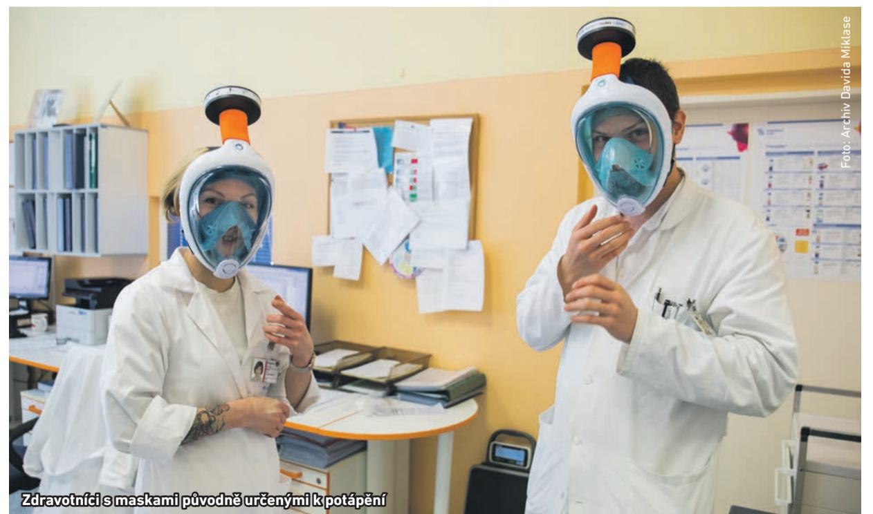
Zdravotníci s maskami původně určenými k potápění