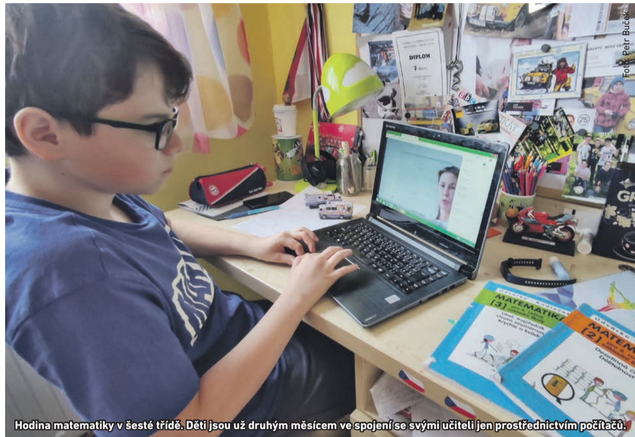
Hodina matematiky v šesté třídě. Děti jsou už druhým měsícem ve spojení se svými učiteli jen prostřednictvím počítačů.

Už půldruhého měsíce zůstává uzavřená radotínská základní škola. Jejich 850 žáků se učí ze svých domovů. Do školy se podle plánů vlády z půlky dubna vrátí na konci května žáci 1. stupně a v červnu bude probíhat v omezené formě výuka na 2. stupni. Docházka však nebude povinná, obvyklé vysvědčení na konci školního roku děti patrně nedostanou ( stav k 22. dubnu ).