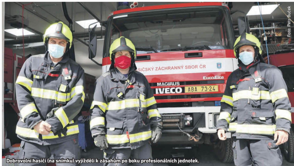
Dobrovolní hasiči (na snímku) vyjíždějí k zásahům po boku profesionálních jednotek.

Jednotka dobrovolných hasičů z Radotína se do boje s koronavirem zapojila hned na několika frontách. Dvakrát týdně držela celodenní pohotovost na své stanici, protože některé skupiny pražských profesionálních hasičů zůstaly v karanténě. Aby jim pomáhala při výjezdech k požárům nebo k jiným událostem. Pustila se také do dezinfikování veřejných míst.