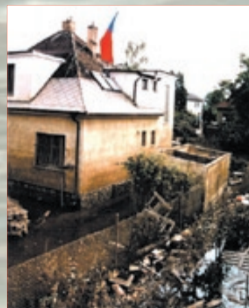
Ze všech zbraslavských částí dopadly nejhůř Lahovice, na snímku pořízeném v ulici K Zahradám bezprostředně po poklesu vody je patrné, kam až byla střecha omývána vodou