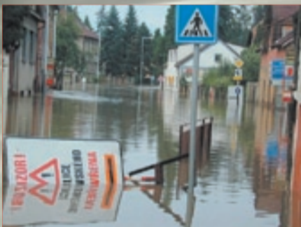
Že se ulicí Žitavského kolem Ottovy vily projet nedá, bylo 14. srpna více než zřejmé