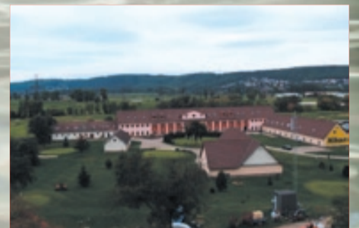
Ruiny se změnily v zázemí Prague City Golf Clubu, který na pozemcích pronajatých od rodiny Bartoňů provozuje golfové hřiště