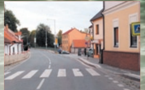
I ulice, která se stále jmenuje U Národní galerie (ač ta již zámek opustila), by měla být dalších povodní ušetřena