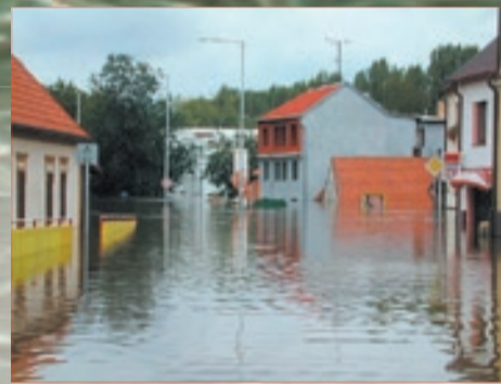
Historické jádro za povodni připomínalo Benátky