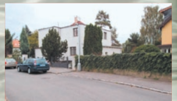
Zde domy stát zůstaly, ale musely samozřejmě projít kompletní rekonstrukcí