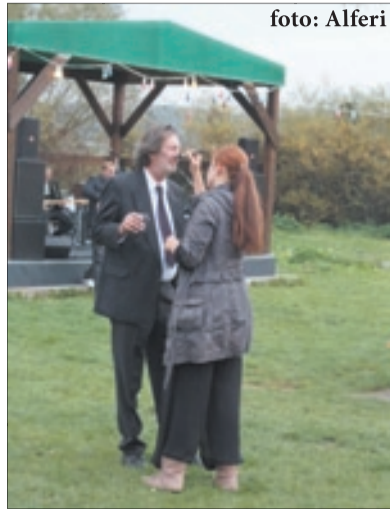
V lázních se objevil i Bolek Polívka

tkat mnoho známých a slavných tváří. Například Bolka Polívku, Miroslava Krobota, Karla Heřmánka, Vojtěcha Dyka, Richarda Genzera, Jakuba Pračáře a další.