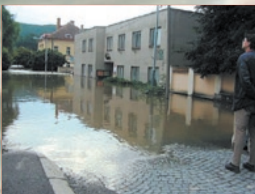
Ulice Opata Konráda se změnila v jeden ze zálivů