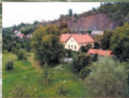
Takový je pohled z mostu dnes – pokud zrovna nezhrozí některá z menších „velkých vod“, které mají ve zvyku zalévat zdejší pozemky