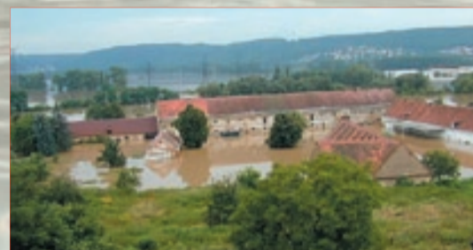
Statek Peluněk u odbočky na Lipence zaplavilo jezero, které se rozlévalo odsud až do Radotína