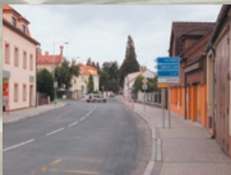
Opravené domy, chodníky i silnice – ten, kdo zde vodu neviděl, by ani nevěřil, že tudy tekla