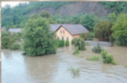
Fotografie ze středy 14. srpna 2002, kdy povodeň kulminovala, ukazuje, jak dopadly domy na Závisti, jejichž zahrady se změnily ve dno řeky