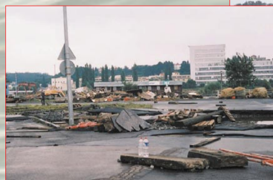
břehu Vltavy z průmyslového areálu na moderní bytové domy

Voda se valila takovou silou přes Dostihovou i Strakonickou ulici, obě na náspu, že je zcela zdevastovala. Na aktuálních snímcích je vidět nejen výstavba protipovodňových