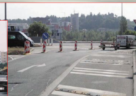
opatření, ale také zásadní proměna modřanského

vozu, Kraslická - část., Loučanská - část., Na Benátkách, Na Rymáni, Přestínská, Šárovo kolo, Tachovská - část., U Jankovky, V Parníku, Václava Balého - část., Věštinská - část., Vrážská, Výpadová).