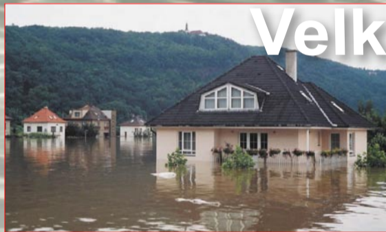
Ulice U Zahradnictví je opět věrná svému názvu

V Městské části Praha 16 (Radotín) bylo zaplaveno 18 ulic (Horymírovo nám., Chrobolská, K Berounce - část., K Lázním, K Pří-