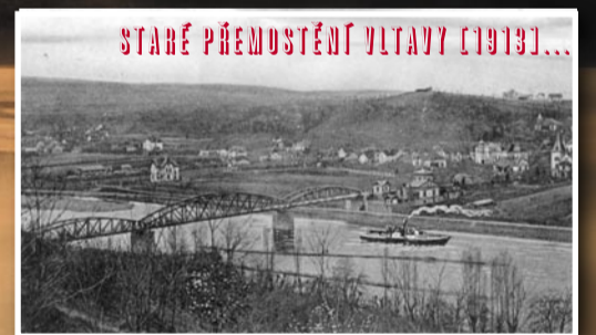
STARÉ PŘEMOSTĚNÍ VLTAVY [1913]...