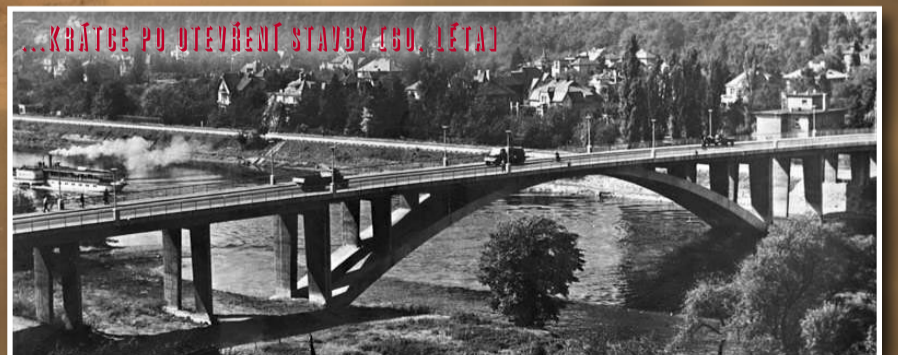
...KRÁTCE PO OTEVŘENÍ STAVBY (80. LĚTA)