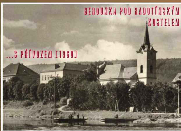
BEROUNKA POD RADOTÍNSKÝM KOSTELEM