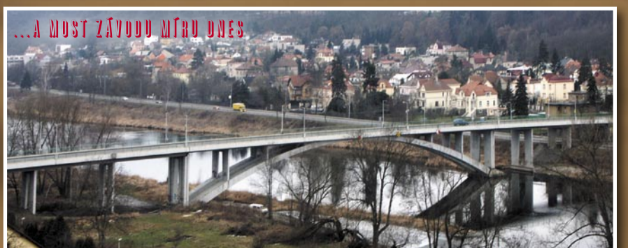
...A MOST ZÁVODU METRU UNES