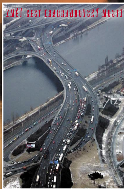
ZMĚŤ BEST (BARANDOVSKÝ MOST)