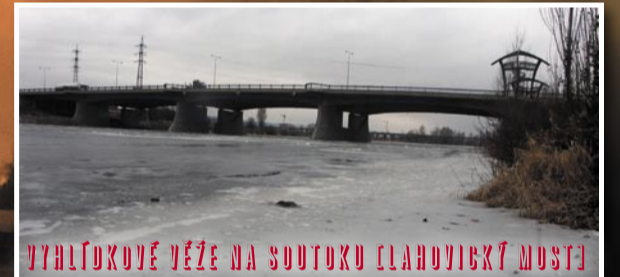
VYHLÍDKOVÉ VĚŽE NA SOUTOKU (LAHOVICKÝ MOST)