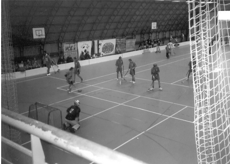
Florbal je mladý sport získávající stále větší popularitu. Buldoci v přípravě před zápasem.