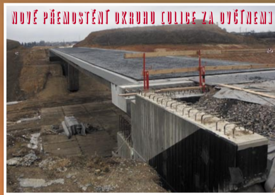
NOVÉ PŘEMOSTĚNÍ OKRUHU [OLIBICE ZA DVĚTĚMÍ]