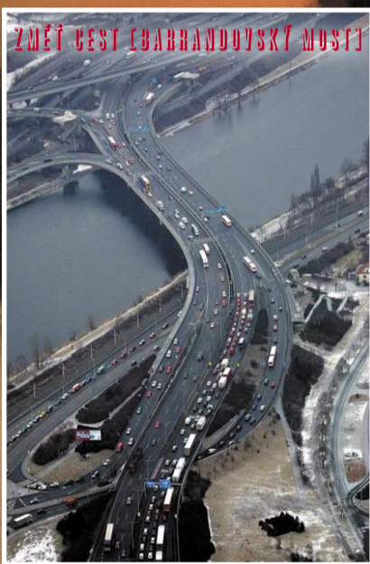
ZMĚŤ BEST [BARANDOVSKÝ MOST]