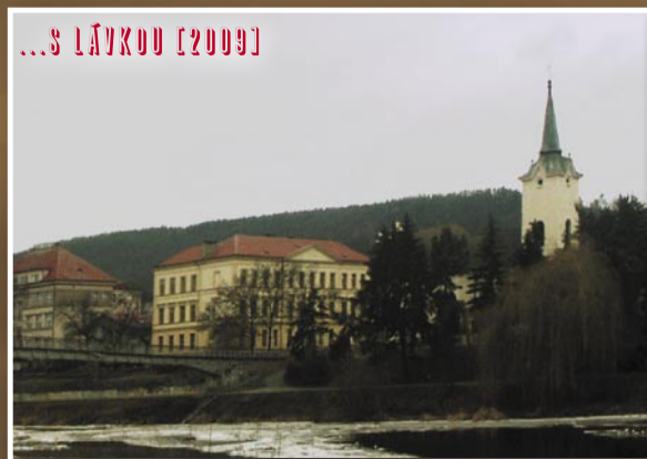
...S LÁVKOU [2009]