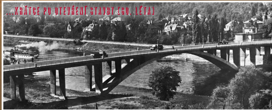
...KRÁTCE PO OTEVŘENÍ STAVBY [80. LĚTA]