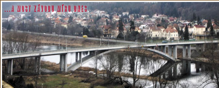
...A MOST ZÁVODU METRU UNES