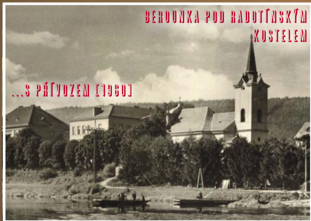
BEROUNKA POD RADOTÍNSKÝM KUSTELEM