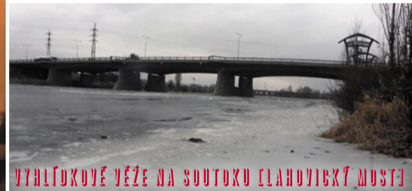
VYHLÍDKOVÉ VĚŽE NA SUTOKU [LAHOVICKÝ MOST]