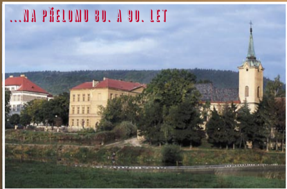
...NA PŘELOMU 80. A 90. LET