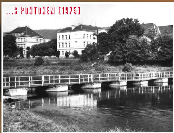
...S PONTONEM [1975]