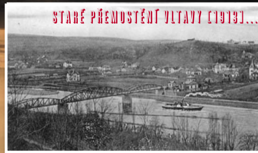
STARÉ PŘEMOSTĚNÍ VLTAVY [1913]...