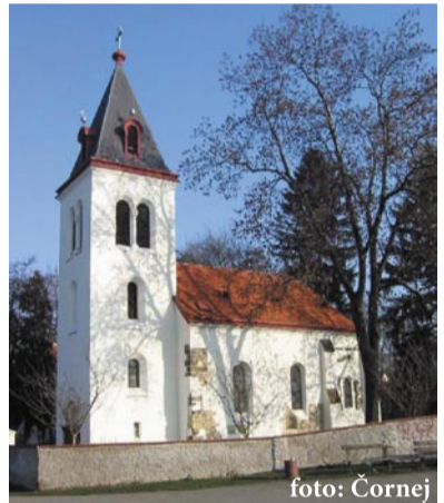
Kostel Panny Marie v Záběhlicích