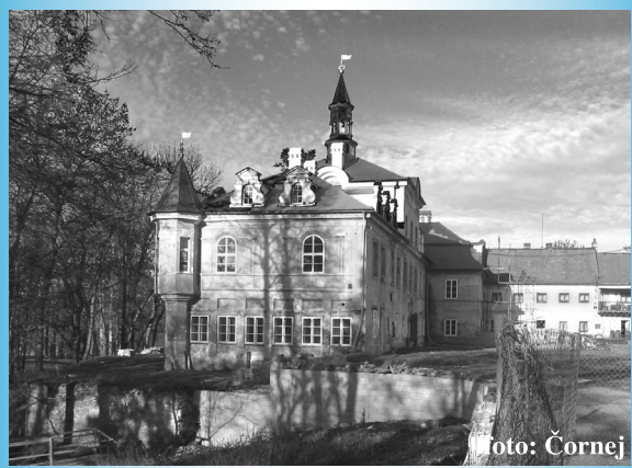
Zámek ve Svinařích

jakýmsi úvozem vyspaným drtí. Potom vede po rovině mezi poli do Litně, kde se napojí na silnici (1,9 km). Zelená značka sice ukazuje,