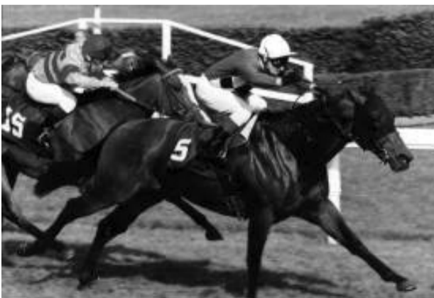
Dostihový sport je atraktivní podívána na spojení výkonu člověka a koně

Druhou listopadovou nedělí, přidáním dostihovým dnem, skončila loňská sezóna na závodišti ve Velké Chuchli. Jejím zásadním kladem byla skutečnost, že se jí po srpnové přírodní katastrofě z předminulého roku podařilo rozběh-