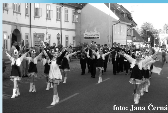
Mažoretky Květinčky Kladno se souborem Choceňka při mažoretkové show

Již tradičně se v pátek večer rozjely kapely do okolí, aby pozvaly co největší množství obyvatel okolních obcí a posluchačů této muziky na Zbraslav. Například soubor Midtun Pavillion orkester z norského města Bergenu koncertoval v Radotíně a o diváky neměl nouzi!