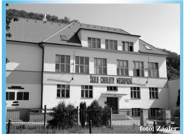
Škola nese jméno Charlotty Masarykové, manželky prvního československého prezidenta

rodičů, ale také se výrazně finančně podílí na vybavení ústavu učebními pomůckami a během roku přispívá na různé školní akce. V poslední době jsme velmi uvítali např. pořízení keramické pece či dataprojektoru pořize-