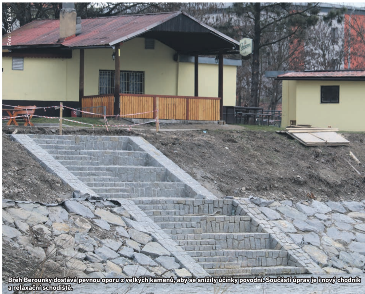
Břeh Berounky dostává pevnou oporu z velkých kamenů, aby se snížily účinky povodní. Součástí úprav je i nový chodník a relaxační schodiště.

Na sociálních sítích se objevuje kritika kácení stromů a dřevin u křižovatky pod Korunou a na břehu Berounky. Obojí odstraňování zeleně však má okolní prostředí vylepšit a udělat bezpečnějším.