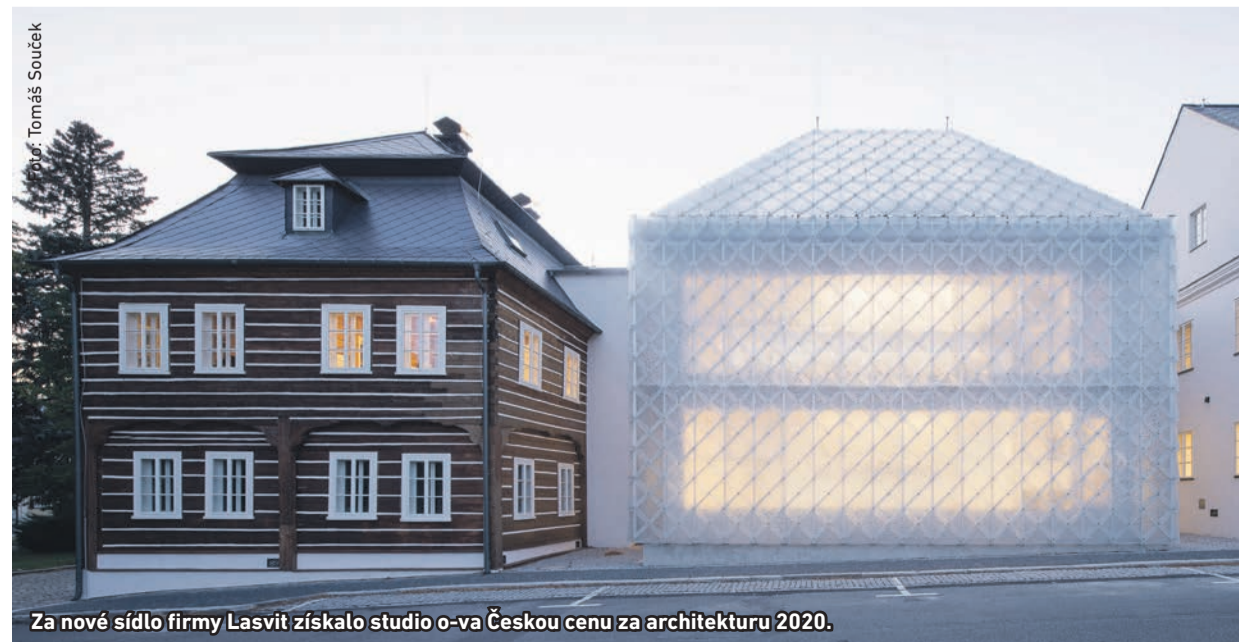
Za nové sídlo firmy Lasvit získalo studio o-va Českou cenu za architekturu 2020.