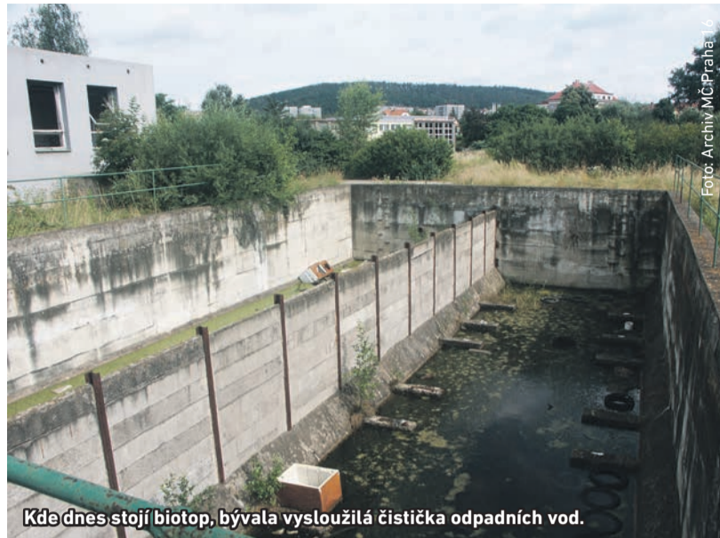
Kde dnes stojí biotop, bývala vysloužilá čistírka odpadních vod.