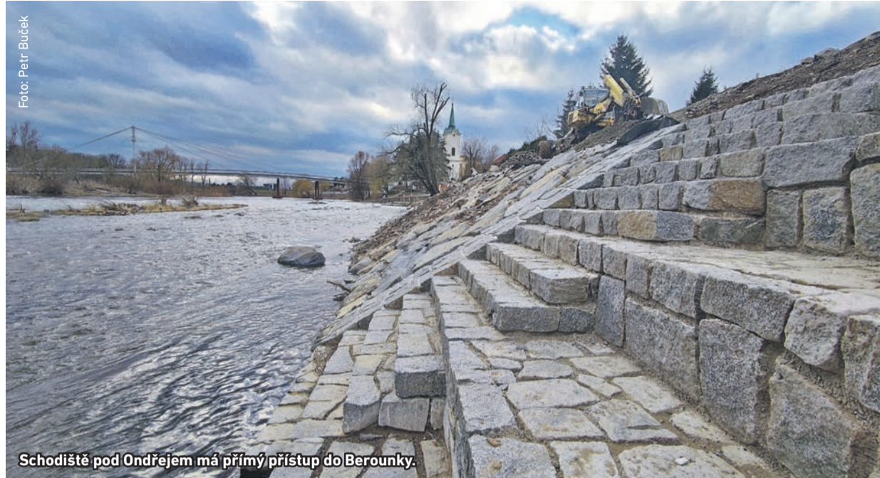
Schodiště pod Ondřejem má přímý přístup do Berounky.