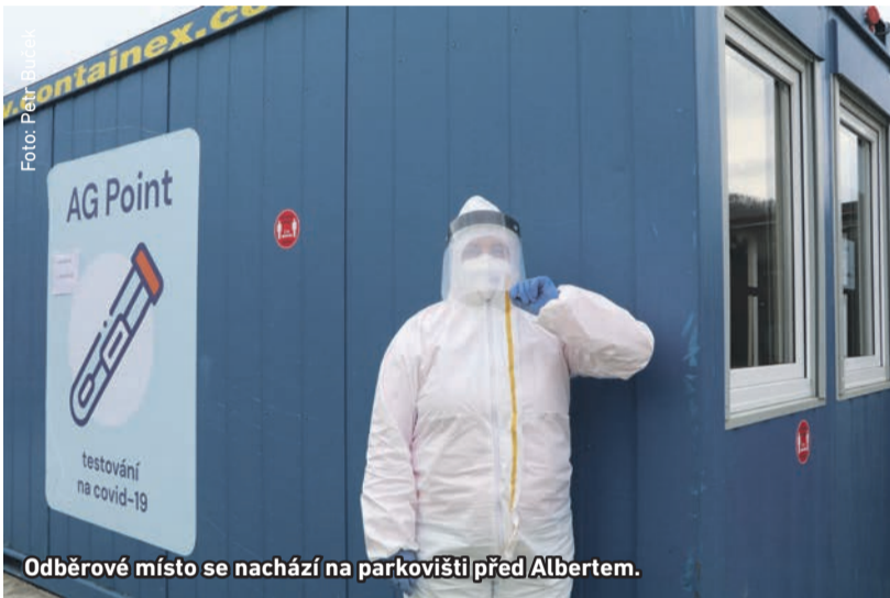
Odběrové místo se nachází na parkovišti před Albertem.