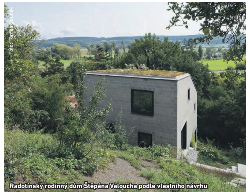
Radotínský rodinný dům Štěpána Valoucha podle vlastního návrhu