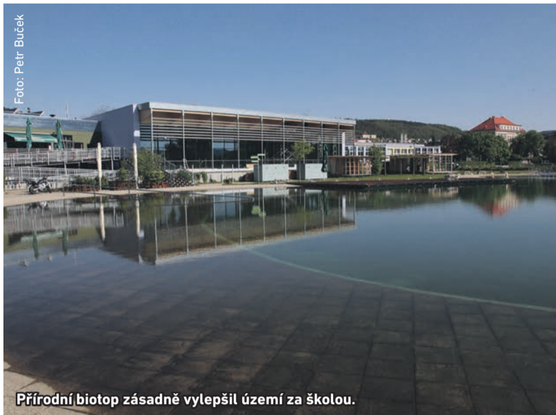
Přírodní biotop zásadně vylepšil území za školou.

Které ekologické projekty radotínská radnice v posledních letech zrealizovala a jaké jsou další plány v této oblasti? Sázejí se nové stromy, stará průmyslová území procházejí proměnou a Berounka zůstane ve své přírodní podobě.