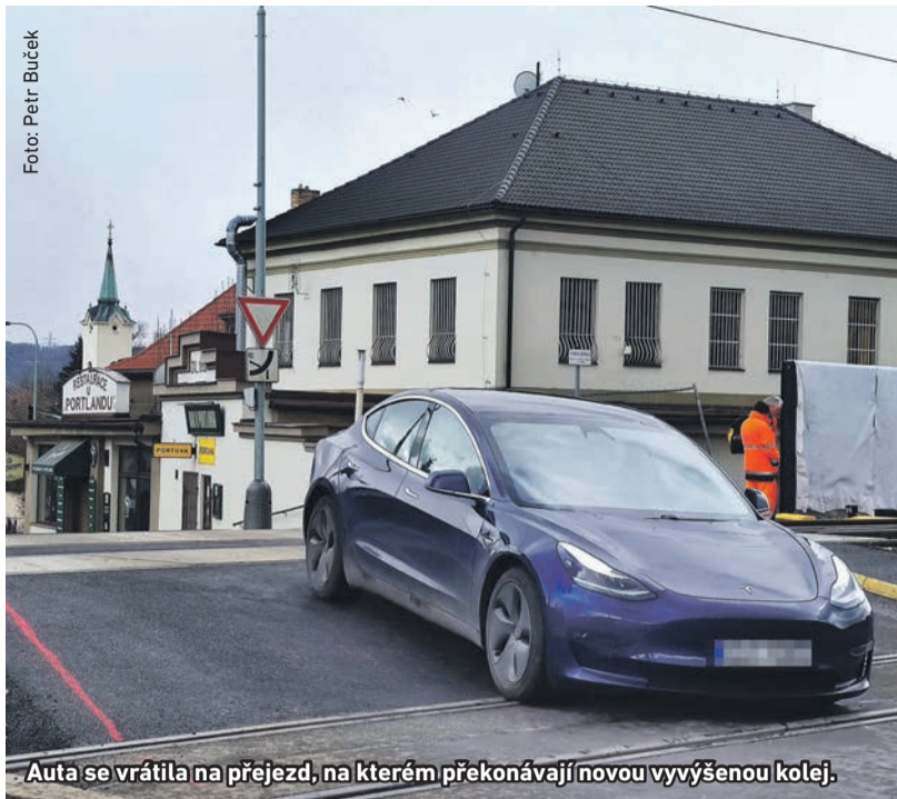
Auta se vrátila na přejezd, na kterém překonávají novou vyvýšenou kolej.