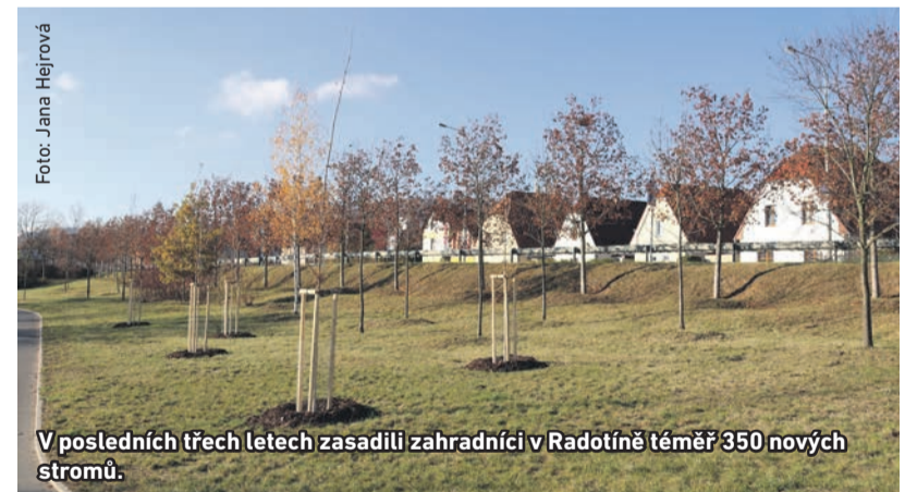
V posledních třech letech zasadili zahradníci v Radotíně téměř 350 nových stromů.

Nové dřeviny byly a jsou navrhovány v souladu se znalostí místních klimatických podmínek, na základě odborných dendrologických konzul-