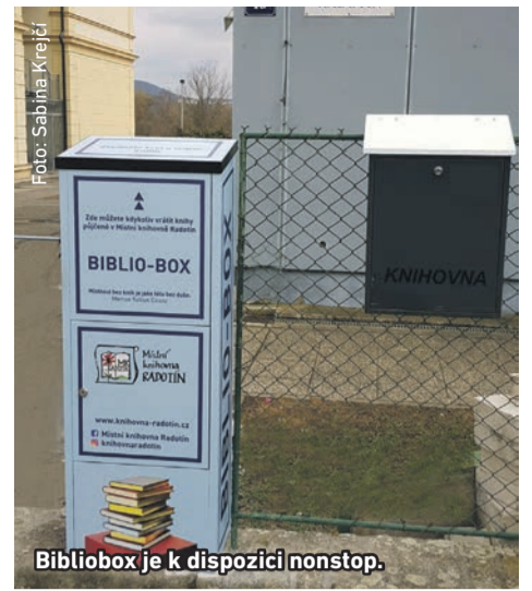
Bibliobox je k dispozici nonstop.