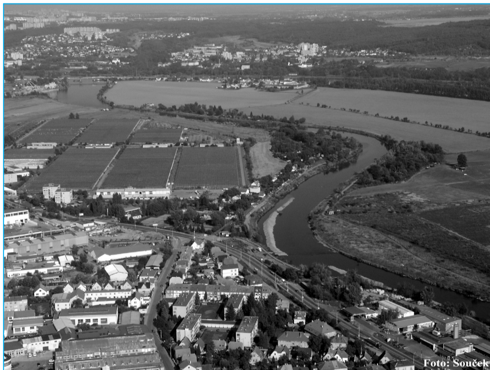
Letecký pohled na východní část Radotína

v oblasti Šárova kola a v cca 1 km níže po proudu. V těchto místech by byl též přístav osobní lodní dopravy a vjezd do sportovní vodní plochy pro menší plavidla. Vodní plocha blíže Velké Chuchle by měla odtokový kanál do Vltavy v oblasti pod Lahovicemi. Celý prostor by byl opatřen doprovodnou zelení včetně cyklostezky a dalších odpočinkových ploch, jakož i doprovodných staveb