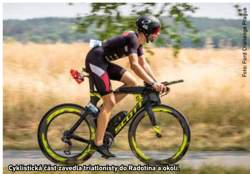
Cyklistická část zavedla triatlonisty do Radotína a okolí.

N ejvětší triatlonový závod na území České republiky zavítal na konci července do Radotína. Klání Ford Challenge Prague se účastnilo celkem 1360 závodníků ze 47 zemí. Tisícovka z nich se postavila na start hlavního závodu. Na triatlonisty nejdříve čekalo plavání ve Vltavě dlouhé 1,9 kilometru, poté přesedli na kola, aby urazili devadesátikilometrový okruh. Nakonec ještě museli do cíle zdolat 21,1 kilometru běhu.