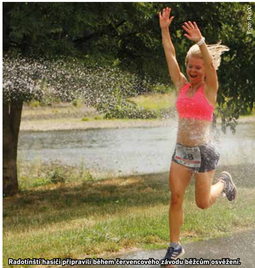
Radotínští hasiči připravili během červencového závodu běžcům osvěžení.

L etošního druhého ročníku závodu RunX, který se konal na konci července, se zúčastnilo bezmála 80 jednotlivců v trase na 15 kilometrů a 25 dvojic v závodech na dvakrát 7,5 kilometru. Na start dětského pětisetmetrového běhu se postavilo 15 malých závodníků.