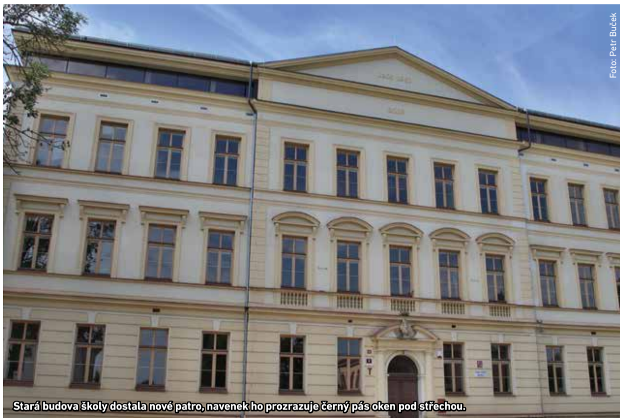
Stará budova školy dostala nové patro, navenek ho prozrazuje černý pás oken pod střechou.

Od pondělí 2. září mají děti z radotínské základní školy k dispozici další nové prostory. Mohou se těšit na rozšířenou jídelnu, čtyři třídy prvního stupně se stěhují do vestavby historické budovy s nádherným výhledem a naplno se rozjíždí provoz bazénu.