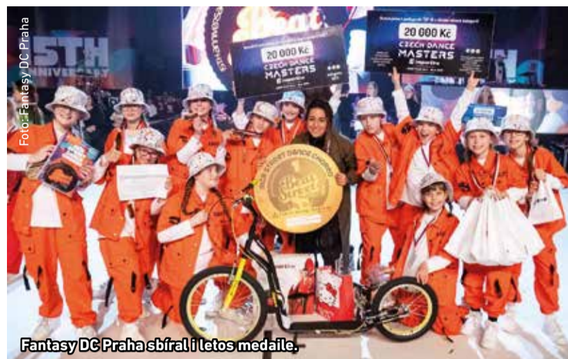
Fantasy DC Praha sbírala i letos medaile.

R adotínské taneční studio Fantasy DC Praha patří již několik let k nejúspěšnějším tanečním streetovým klubům v ČR. Také letos předváděly soutěžní týmy FDC své choreografie nejen na