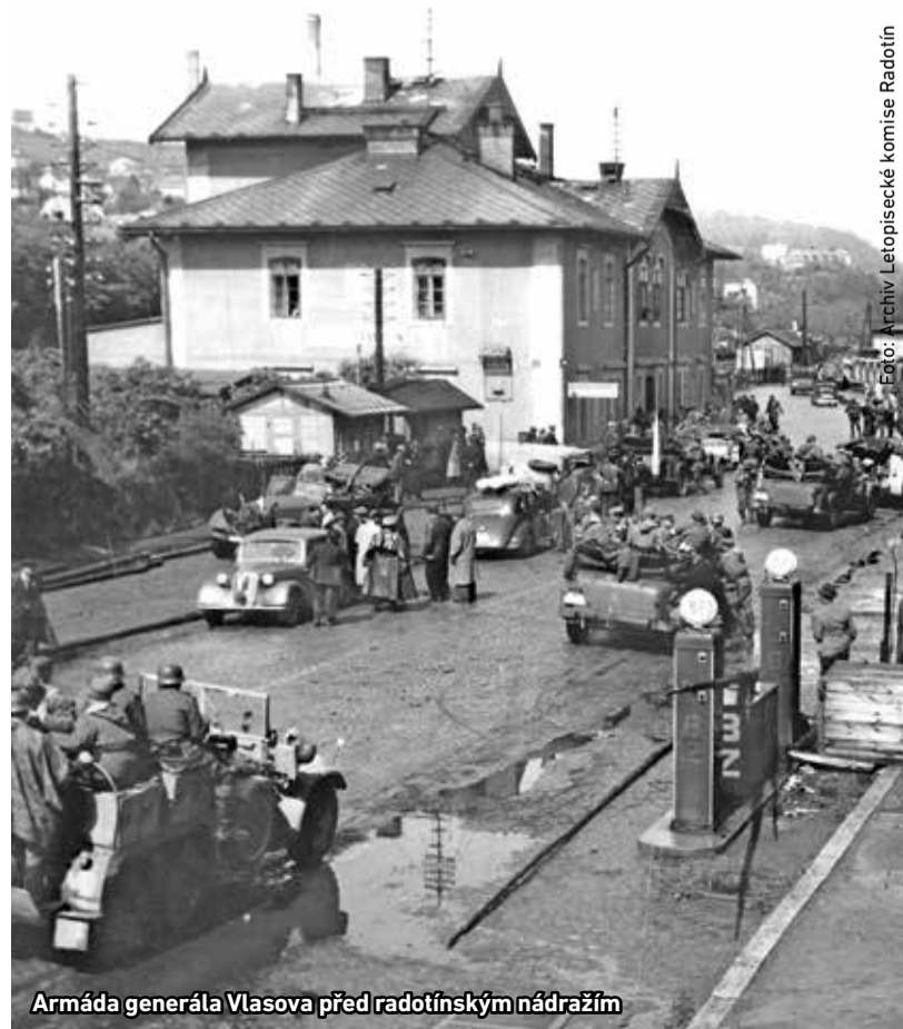
Armáda generála Vlasova před radotínským nádražím