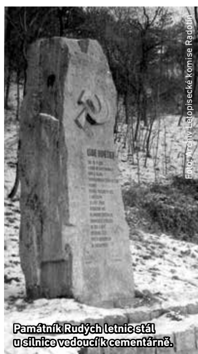
Památník Rudých letnic stál u silnice vedoucí k cementárně.