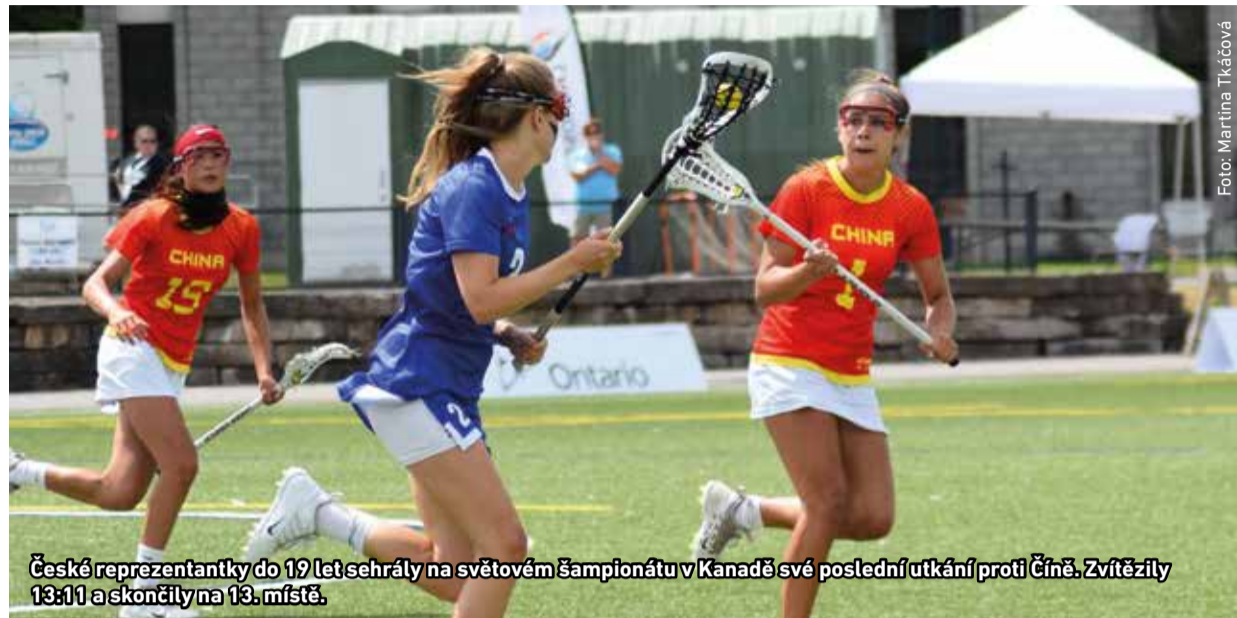
České reprezentantky do 19 let sehrály na světovém šampionátu v Kanadě své poslední utkání proti Číně. Zvítězily 13:11 a skončily na 13. místě.

Ženský národní tým přivezl z červencového mistrovství Evropy bramborovou medaili. A lakrosové juniorky České republiky vybojovaly na srpnovém mistrovství světa 13. místo. Významnou část obou reprezentačních družstev vytvořily hráčky radotínského LCC.