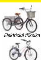
E-bike Foreza Leader Fox

Praha 5 – Radotín, (Staré) Sídliště 1082, poblíž zdravotního střediska, konečná bus 244 www.elektrokolo.cz tel.: 602 856 404