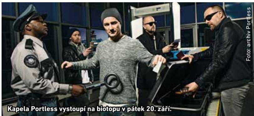
Kapela Portless vystupují na biotopu v pátek 20. září.

Radotínský biotop letos slaví páté výročí svého fungování. Kulaté jubileum připomene oslava, která se uskuteční v pátek 20. a v sobotu 21. září. První den popřeje biotopu kapela Portless. A v sobotu se mohou návštěvníci těšit na koncerty Dana Bárty a jeho souboru Illustratosphere.