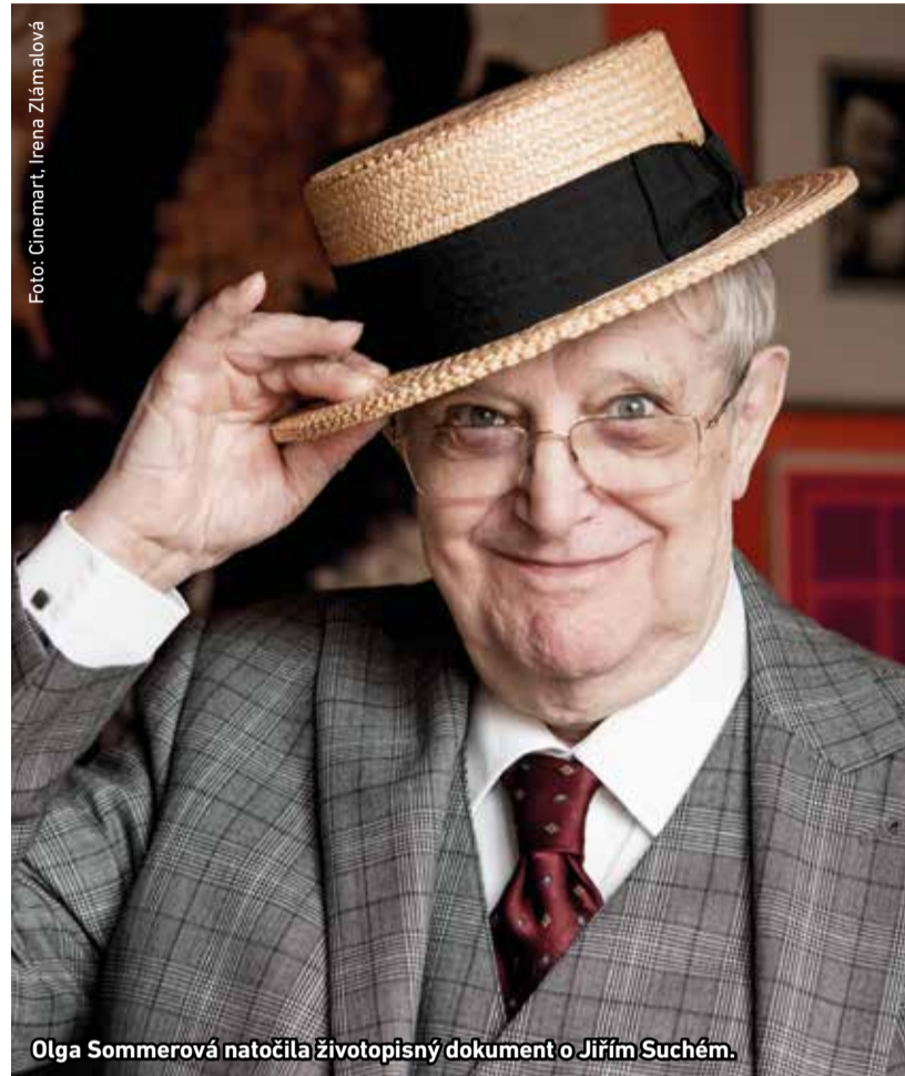
Olga Sommerová natočila životopisný dokument o Jiřím Suchém.

O Jiřím Suchém byly už v minulosti natočeny filmy, které se zaměřovaly spíše na konkrétní mezníky jeho divadelní tvorby. Film Jiří Suchý – Lehce s životem se prát se více věnuje umělcovu životu. Hlavním cílem Olgy Sommerové bylo vytvořit atraktivní životopisný a tvůrčí portrét Jiřího Suchého jinak, než jak byl doposud prezentován. Film ho představuje v archívních záběrech, ale soustředí se i na jeho současnou tvorbu a situace z profesního a osobního života. ■