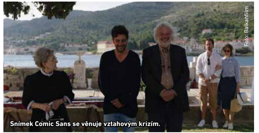
Snímek Comic Sans se věnuje vztahovým krizím.

Kino Radotín uvede v úterý 10. září od 20 hodin chorvatskou komedii Comic Sans a po ní krátkou sci-fi parodií Teleport Zovko.