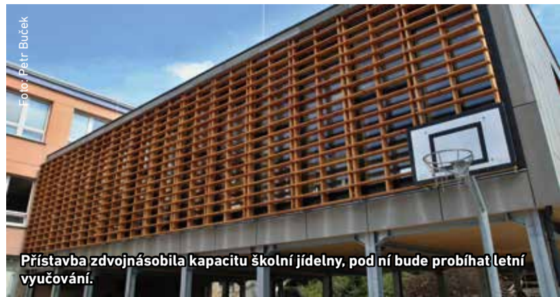
Přístavba zdvojnásobila kapacitu školní jídelny, pod ní bude probíhat letní vyučování.