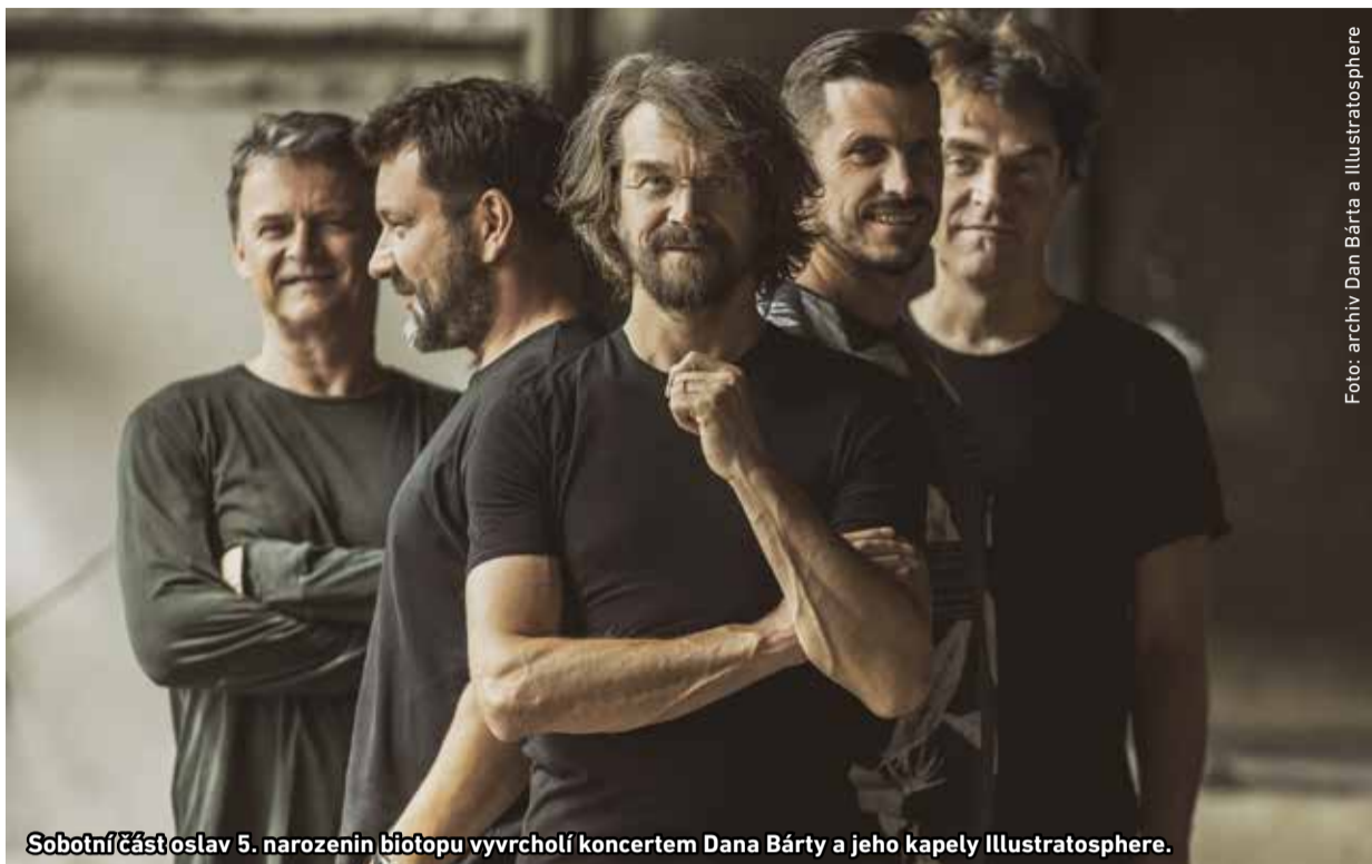
Sobotní část oslav 5. narozenin biotopu vyvrcholí koncertem Dana Bárty a jeho kapely Illustratosphere.