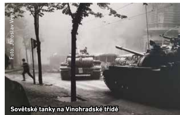
Sovětské tanky na Vinohradské třídě