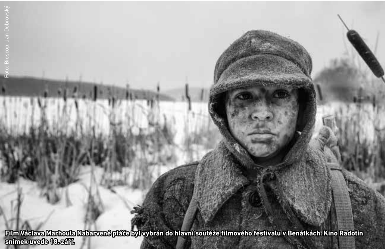
Film Václava Marhoula Nabarvené ptáče byl vybrán do hlavní soutěže filmového festivalu v Benátkách. Kino Radotín snímek uvede 18. září.

8:30–12:30, farmářský trh na Zbraslavském náměstí