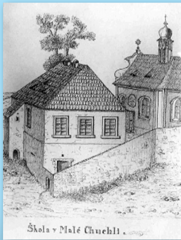
Škola v Malé Chuchli