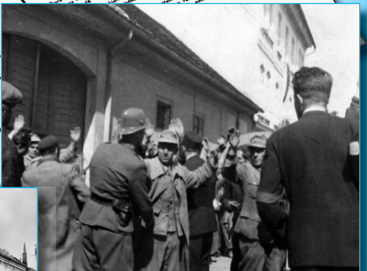
Ozbrojení Wermachtu 5.5.1945 na Zbraslavi