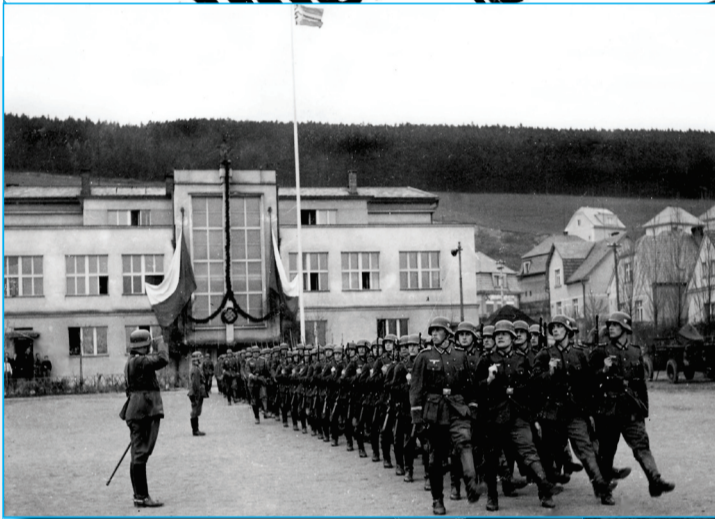
Nacistická armáda v radoťínské sokolovně 20.4.1939