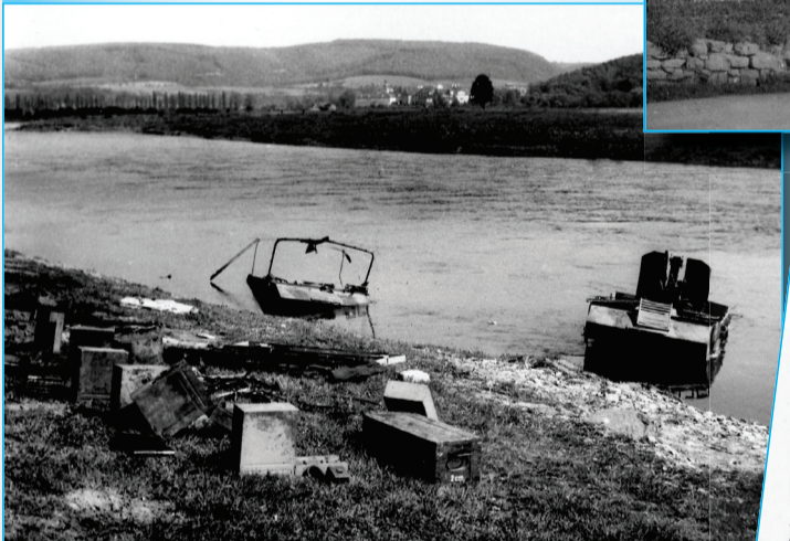
Pozůstatky nacistické techniky v Radoťíně