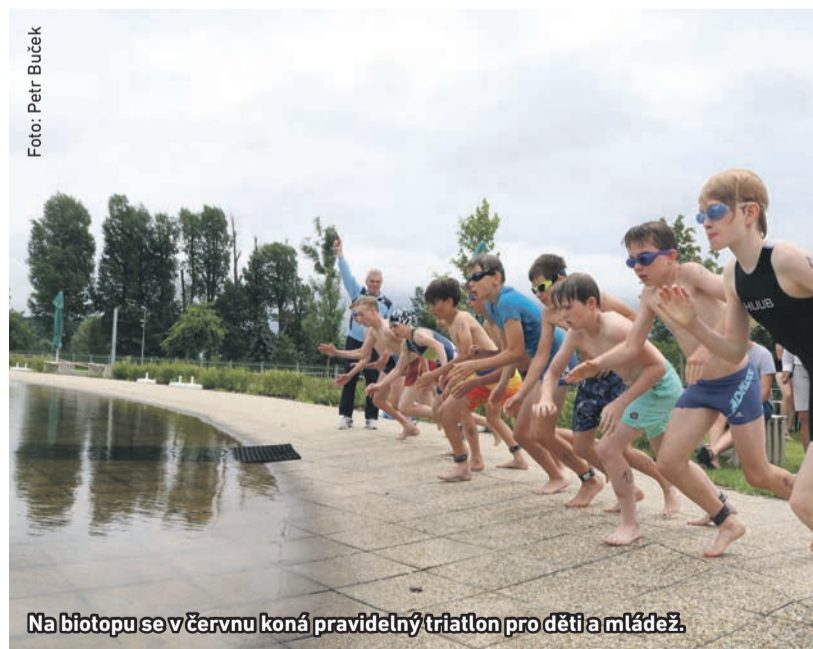
Na biotopu se v červnu koná pravidelný triatlon pro děti a mládež.