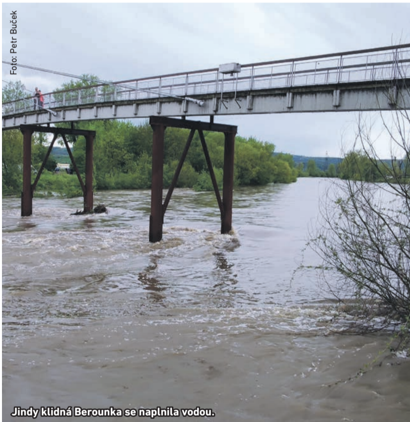
Jindy klidná Berouňka se naplnila vodou.