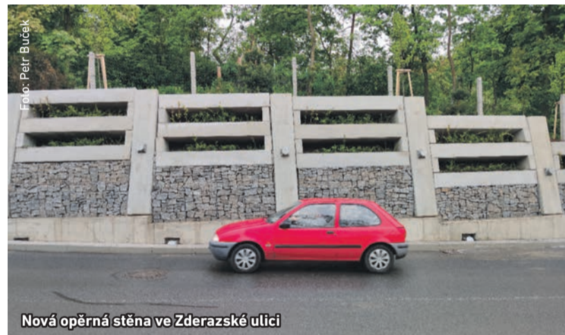
Nová opěrná stěna ve Zderazské ulici