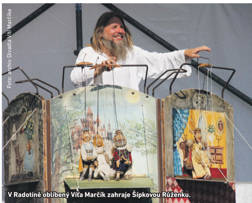
V Radotíně oblíbený Víta Marčička zahraje Šípkovou Růženku.