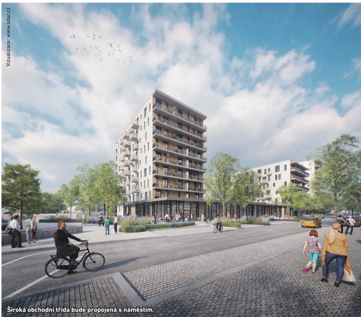
Široká obchodní třída bude propojená s náměstím.