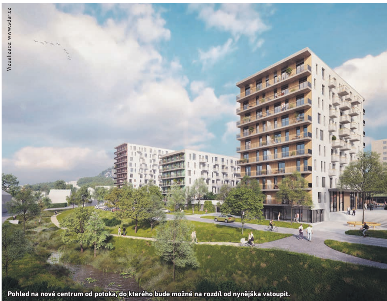
Pohled na nové centrum od potoka, do kterého bude možné na rozdíl od nyní vstoupit.

Jisté už je, jakým způsobem proběhne vyrovnání mezi městskou částí a developerskou firmou. Radnice prodá developerovi své pozemky a ten na těchto parcelách postaví tři obytné domy, obchodní prostory, novou širokou obchodní třídu, parkovací místa i náměstí. A také mimo jiné zbabí půdu pod bývalou továrnou na akumulátory škodlivých látek, které tam zanechala průmyslová výroba. Obytné domy poté developer prodá majitelům nových bytů a vybudovaná hlavní třída, náměstí a upravený břeh Radotínského potoka případnou zpatky Městské části Praha 16.