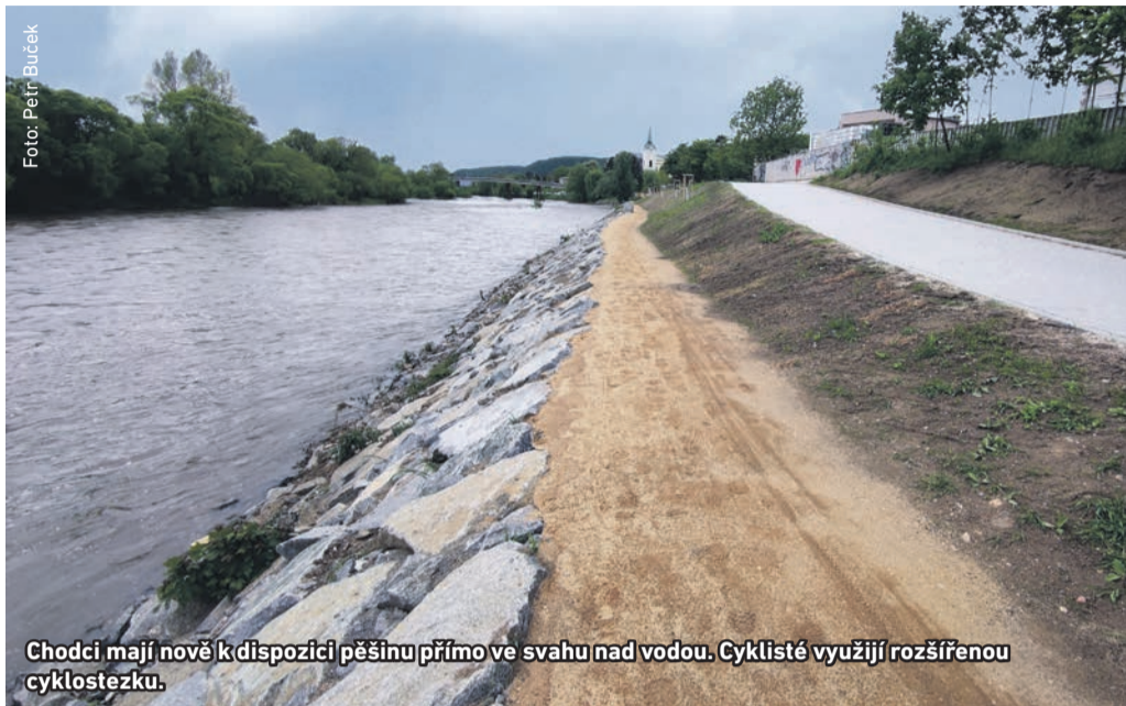
Chodci mají nově k dispozici pěšinu přímo ve svahu nad vodou. Cyklisté využijí rozšířenou cyklostezku.