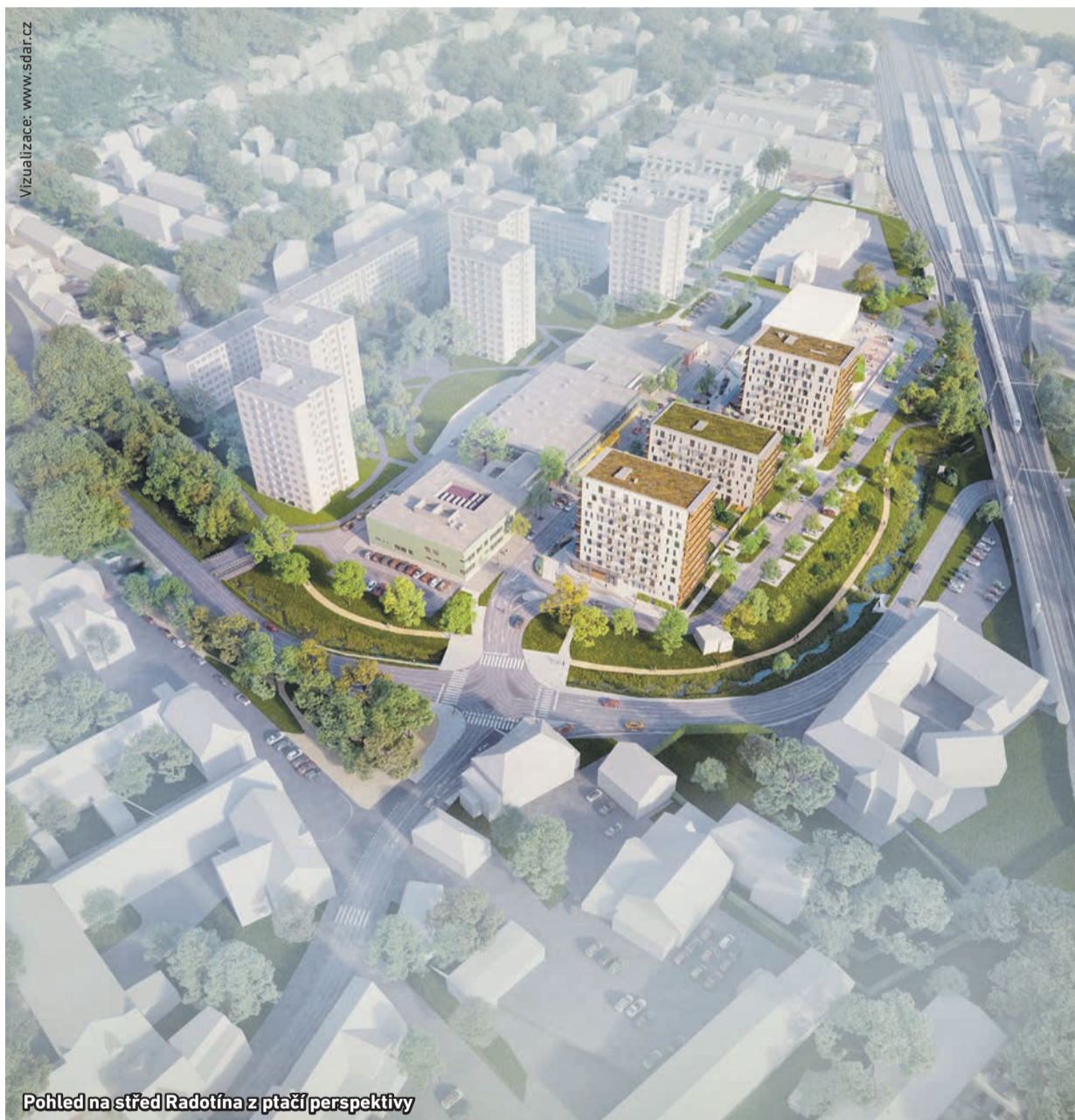
Pohled na střed Radotína z ptáčích perspektiv

ci a lemující trať, která spojí podchod u Rozmarýnu s místem, kde je dnes železniční přejezd. Napojuje se na celé území v logickém bodě, a proto obslouží větší část pěších. Most u dnešního přechodu k Rozmarýnu tak bude využíván méně. Proto by v tomto místě měl břeh pozvolna klesat a získat přirozený ráz, po kterém bude možné k potoku sejít. Podél potoka by měla vzniknout příjemná pěšina se vzrostlou zelení. Celé místo bude hodně přirozené. A bude umět výhodně, přirozeně a inovativně nakládat s dešťovou vodou z velké části Centra Radotín.