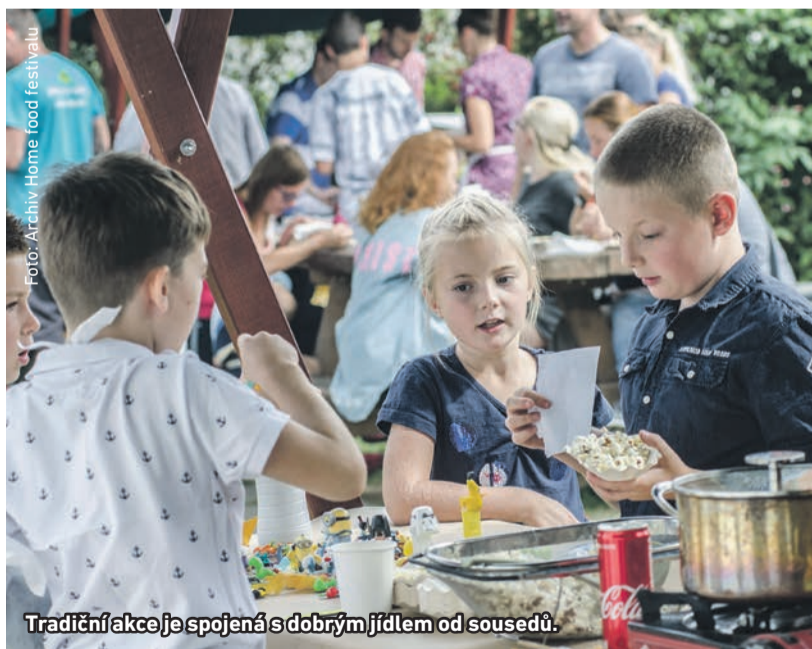
Tradiční akce je spojená s dobrým jídlem od sousedů.