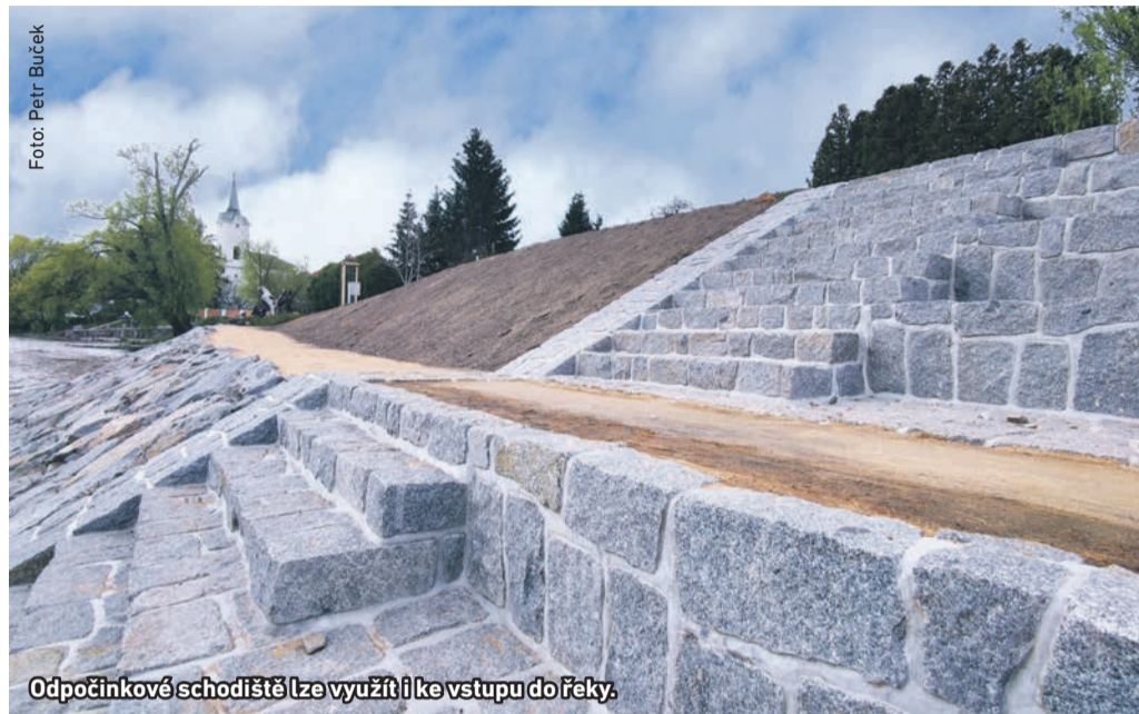
Odpočinkové schodiště lze využít i ke vstupu do řeky.