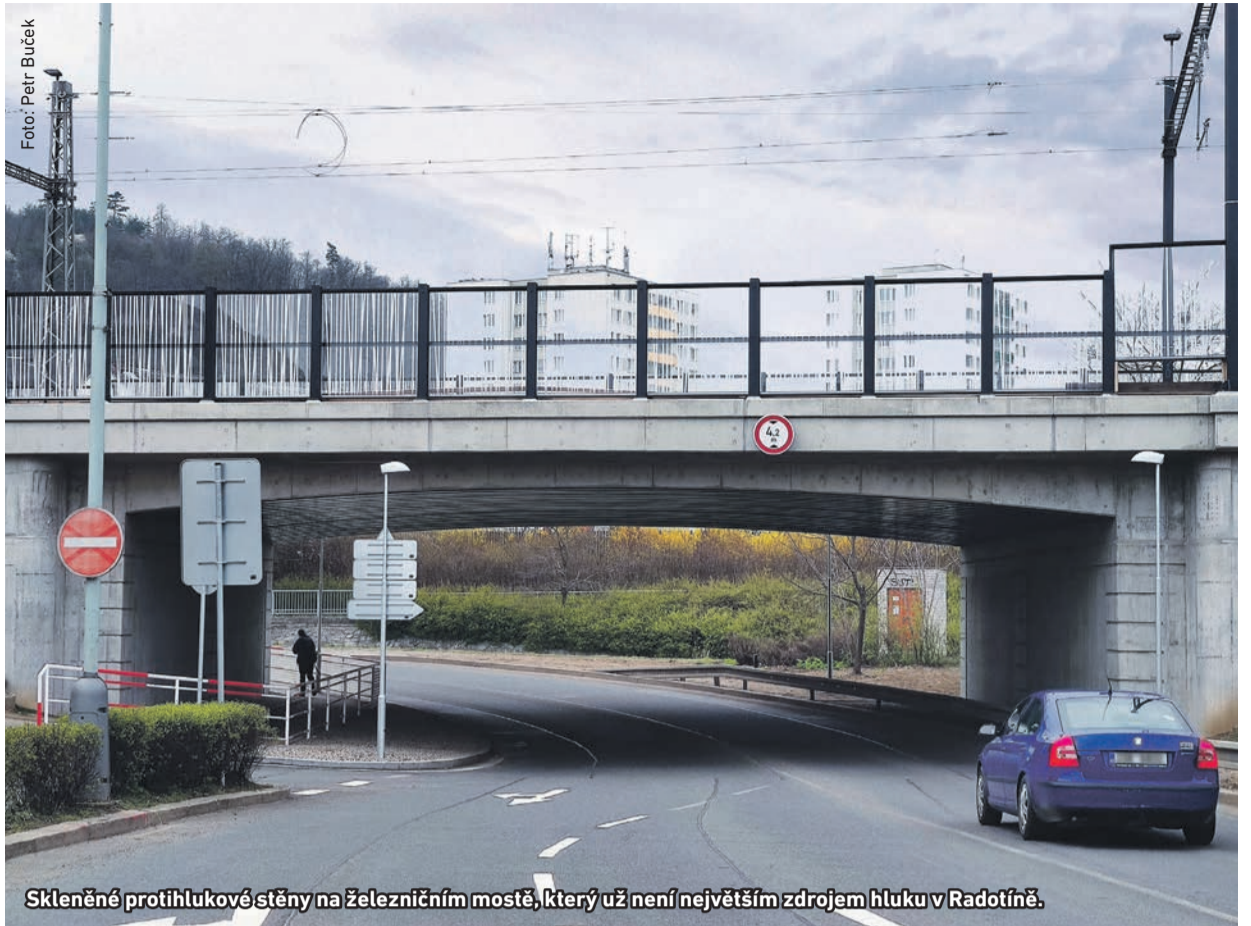
Skleněné protihlukové stěny na železničním mostě, který už není největším zdrojem hluku v Radotíně.