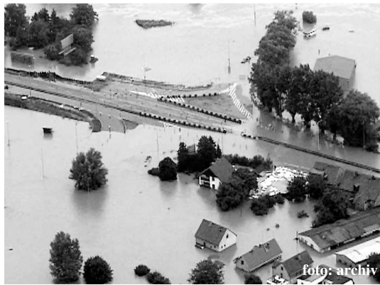
Letecký pohled na část zatopených Lahovic

jsou v našich zeměpisných šířkách jevem pradávným, lidé při své expanzi postupně rozšiřovali svá obydlí a činnosti i do míst, která dříve sloužila