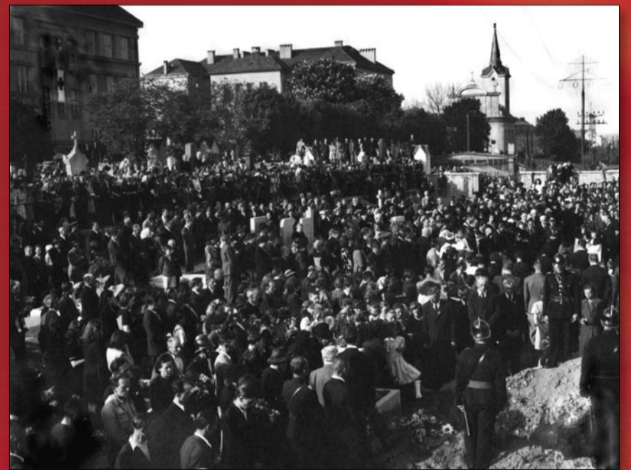
Pohřeb obětí květnových událostí v Radotíně