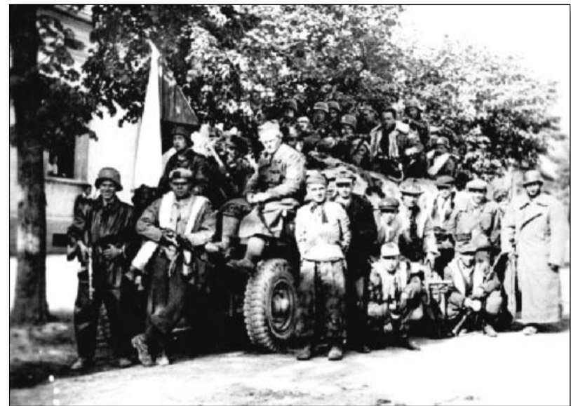
Ozbrojená skupina v Radotíně s ukořistěným obrněným vozidlem

Zbraslav v té době již čelila postupu jednotek SS v úseku Baní. Záběhlice byly pod dělostřeleckou palbou. Ačkoli se v Břežanském údolí podařilo zajmout 600 mužů jízdního oddílu, nebylo možné ubránit ani tuto oblast,