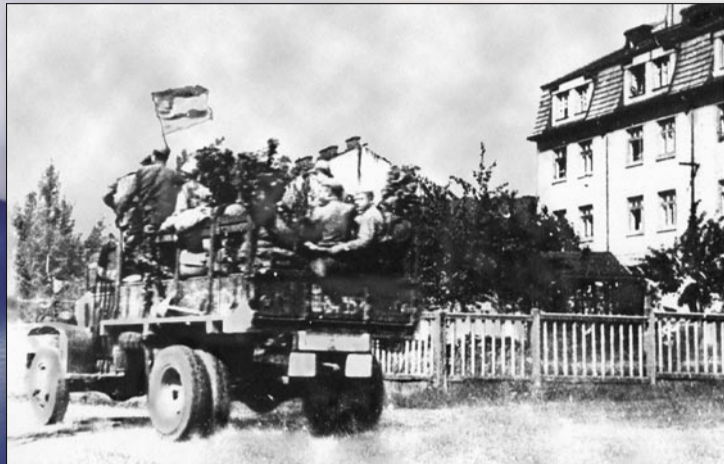
Příjezd Rudé armády do Radotína (po dnešní ul. Vypadová)