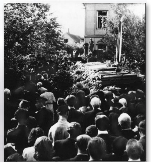
Pocta květnovým obětem před kostelem sv. Petra a Pavla