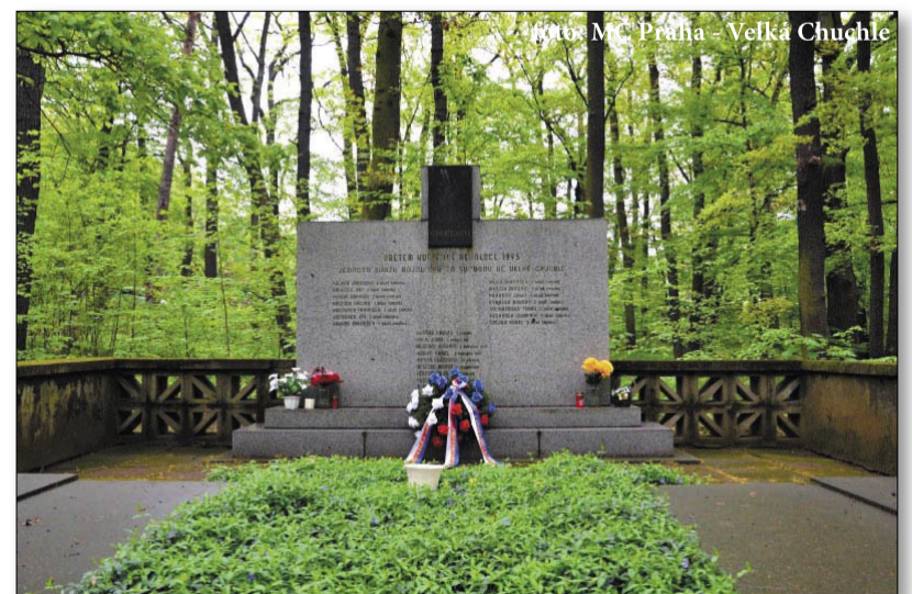
Chuchelští padlí a zavraždění jsou pochováni v chuchelském háji