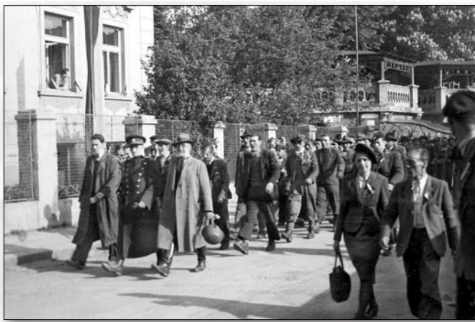
Atmosféra květnových dní na Zbraslavi