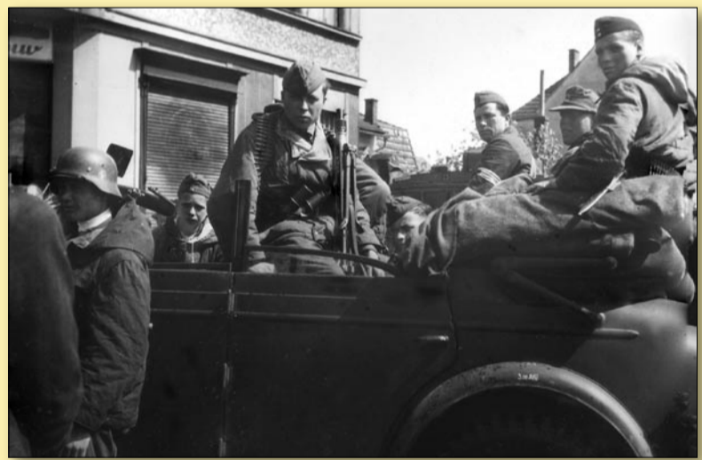
Vojáci ROA v Radotíně

V prostoru Radotína, Chuchle a Zlíchova operoval první pluk ROA podplukovníka Archipova. -kd-