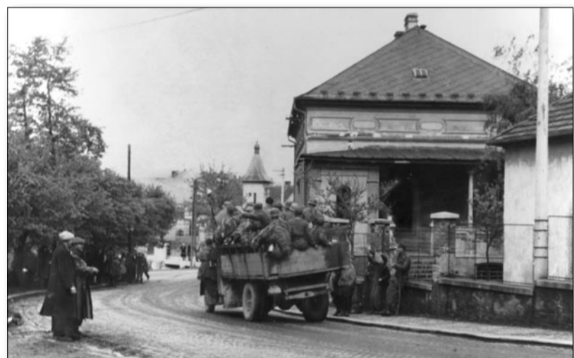
Vítání projíždějících vlasovců u radotínských Korun

již v 8 hodin stál na mostě tank namířený proti Závisti. Při vyjednávání velitel SS prohlásil, že když se zbraslavská posádka nevzdá, nechá pobít veškeré obyvatelstvo a spálí město. Generál Mejstřík se v této beznadějně situaci rozhodl zastavit boj a uvědomit o tom vlastní jednotky. Sám se pak vydal do Prahy oznámit kapitulaci Českého národního radě. To, že padl hned