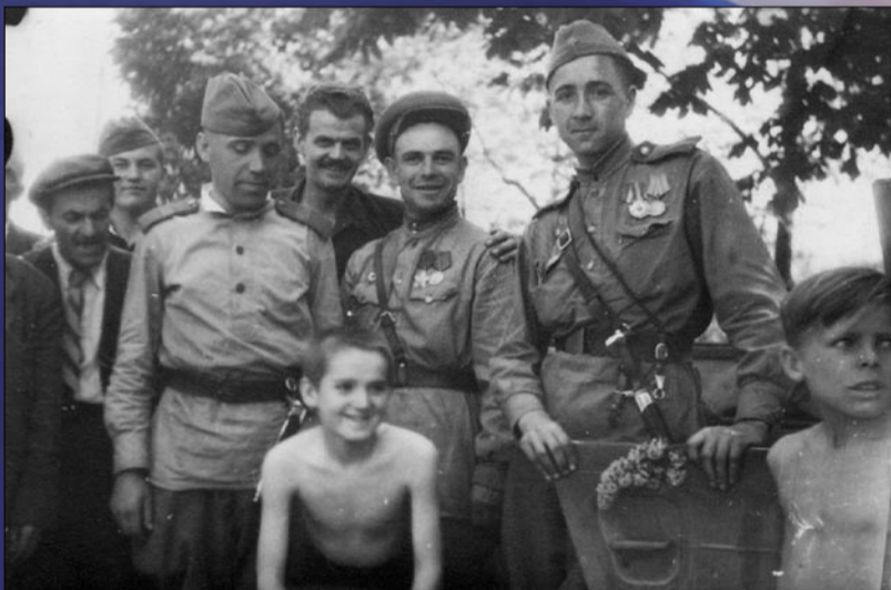
Momentka s rudoarmějci

Povolávací rozkaz pro Zbraslav zew 17. května 1945