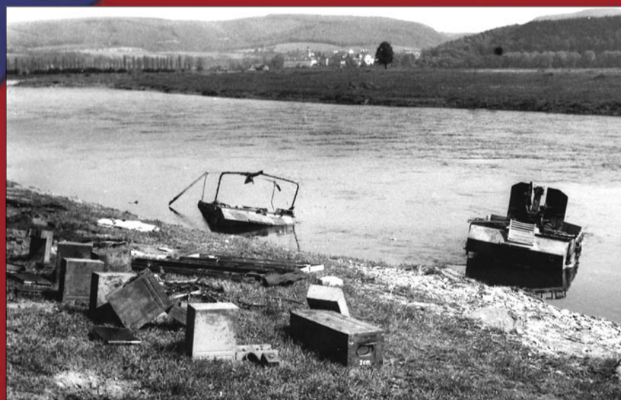
Pozůstatky nacistické techniky v Radotíně