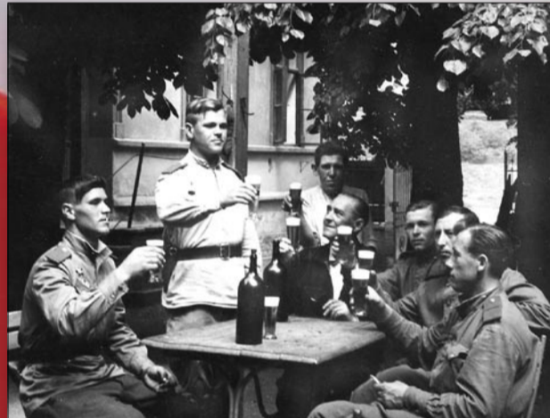
Rudoarmějci před restaurací U Přívozu na Zbraslavi