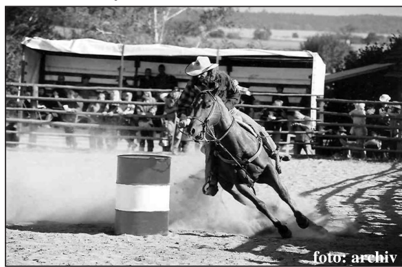
Barelový dostih je Martinov parádní disciplína